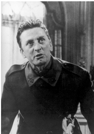
Les Sentiers de la gloire de Stanley Kubrick Collections de la Cinémathèque de Toulouse

« Les sentiers de la gloire ne mènent qu'à la tombe » : ce vers tiré d'un poème de Thomas Gray servit de titre à un roman d'Humphrey Cobb publié en 1935. Il relatait un procès intenté à l'armée française par des veuves de guerre. Stanley Kubrick s'en est inspiré pour raconter comment un général français décide une offensive impossible en 1916, alors que le conflit s'est enlisé. Repoussé par le feu ennemi, le régiment se replie. Le général fait porter la responsabilité à la lâcheté des soldats français et fait fusiller trois hommes pour l'exemple.