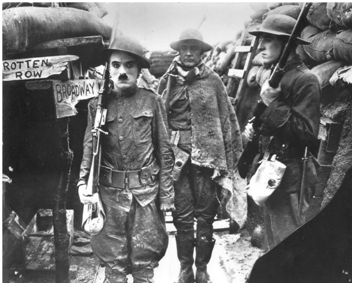
Charlot Soldat de Charles Chaplin