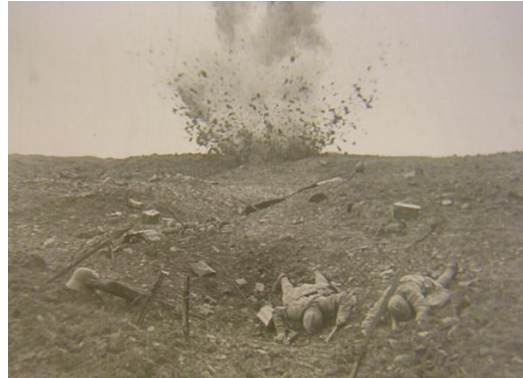
Verdun, visions d'Histoire de Léon Poirier Collections de la Cinémathèque de Toulouse

Dédié à « tous les martyrs de la plus affreuse des passions humaines, la guerre », Verdun, visions d'Histoire se présente comme le récit circonstancié de la célèbre bataille qui fit plus de 200 000 morts entre février et octobre 1916. Mais il ne s'agit pas d'un simple reportage. Léon Poirier inscrit dans la grande histoire le destin de personnages symboliques choisis de part et d'autre du front