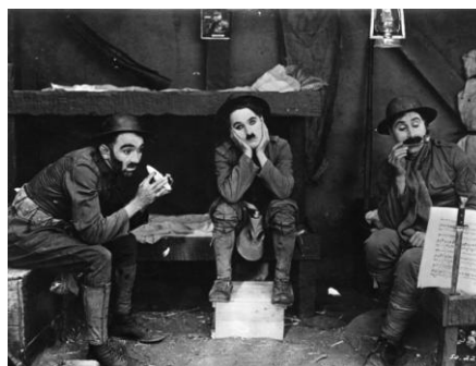
Collections de la Cinémathèque de Toulouse

Renseignements : joelle.cammas@lacinemathequedetoulouse.com