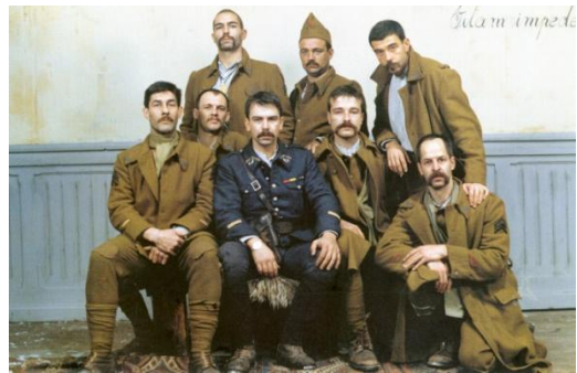
Capitaine Conan de Bertrand Tavernier

Norbert, un intellectuel mobilisé, seul ami de Conan, nommé commissaire-rapporteur, fidèle à ses convictions, a la délicate mission d'arrêter et de faire condamner les coupables. Les hommes de Conan sont évidemment les premiers suspects ; malgré la fureur de Conan qui les défend envers et contre tout, Norbert fera son devoir. Les deux amis vont s'opposer, se séparer, se retrouver aussi de manière inattendue.