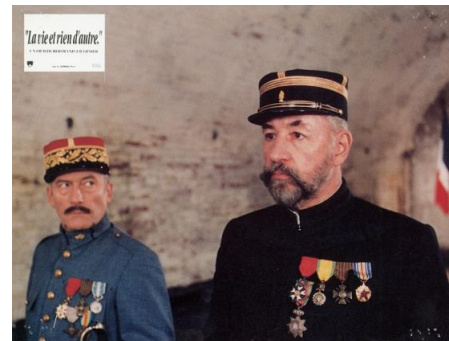
La Vie et rien d'autre de Bertrand Tavernier