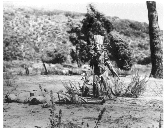
Charlot soldat de Charles Chaplin