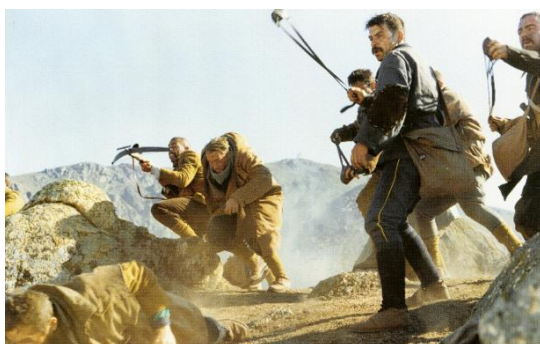
Capitaine Conan de Bertrand Tavernier

Au moment où la Première Guerre mondiale éclate, le cinéma a vingt ans à peine. C'est un art jeune, encore muet, dont le langage propre se constitue peu à peu. En raison de sa capacité à enregistrer et à reproduire le réel, il est sollicité pour rendre compte de ce conflit mondial, dont le nombre de victimes sera sans précédent - 10 millions en quatre ans. Guerre moderne (de par les moyens militaires et les techniques de combat employés) filmée par un médium moderne, la Première Guerre mondiale voit se multiplier les premiers journaux et actualités filmés, instruments de propagande pour influencer l'opinion publique. La fiction a ensuite pris le relais. Malgré l'éloignement temporel, le souvenir de la Grande Guerre est resté vivace. Le traumatisme et l'horreur qu'elle a engendrés