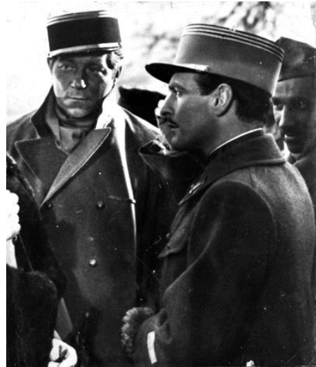
La Grande Illusion de Jean Renoir