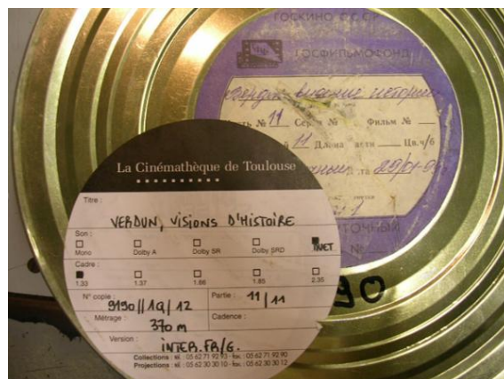
Bobine de Verdun, visions d'Histoire retrouvée par la Cinémathèque de Toulouse

La Première Guerre mondiale occupe une place particulière dans ses collections. Deux films de fiction majeurs abordant la Grande Guerre ont été retrouvés, puis restaurés par la Cinémathèque de Toulouse : Verdun, visions d'Histoire (Léon Poirier, 1928) et La Grande Illusion (Jean Renoir, 1937) font donc partie de la sélection de films proposés aux élèves dans le cadre du Centenaire de la Première Guerre mondiale, aux côtés de La Vie et rien d'autre ou Les Sentiers de la gloire .