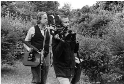
Albert et David Maysles sur le tournage de Grey Gardens (1975)