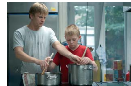
Le Gamin au vélo