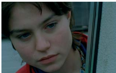
Rosetta (TF1 vidéo)