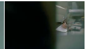
Le Fils (Arte vidéo)