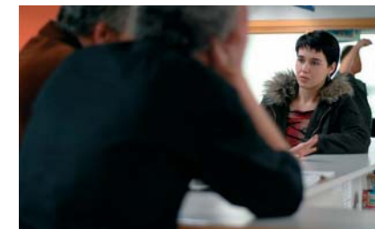
Images extraites du film Jean-Pierre et Luc Dardenne. Devenir un être humain , de Jan Blondeel, 2009, Le Palace

respecter les tournures de phrases exactes qu'ils emploient. La rencontre de deux psychiatres pour parler de l'addiction de Claudy a été déterminante car ils ont assuré aux cinéastes « qu'il n'y a pas de modèles, de comportements types de toxicomanes 3 ».