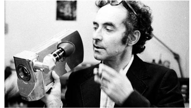
Jean-Luc Godard avec la caméra 35-8

Mais alors que certains cinéastes embrassent volontiers le « style » imposé par la caméra portée – tremblement de l'image au rythme des pas du cadreur, mise au point parfois hésitante, recadrages constants – et en font même leur signature spécifique, d'autres n'aimeraient garder de la caméra portée que l'idée de mobilité. Garrett Brown invente ainsi en 1972 le Steadicam (pour steady camera , ou « caméra stable ») qui permet au cadreur, grâce à un système de poids qui l'équilibre et de bras à ressort, de filmer en marchant et d'obtenir pourtant une image d'une extrême fluidité. Cette technique révolutionnaire, utilisée dès 1976 pour Marathon Man de John Schlesinger et Bound for Glory de Hal Ashby, devient célèbre en 1980 grâce à l'utilisation qu'en fait Stanley Kubrick dans Shining .