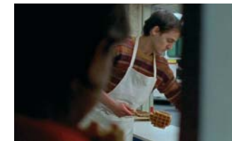
Rosetta

Toutefois, paradoxalement, la frustration du regard du spectateur crée également une impulsion d'identification au personnage, le désir de comprendre ce qu'il pense et ressent. C'est bien ce qu'évoque Luc Dardenne en parlant d'« imagination morale » du spectateur. Autrement dit, le film ne laisse pas croire au spectateur qu'il peut aisément connaître le point de vue d'autrui, mais lui « demande » de tenter de se projeter dans ce point de vue malgré tout. Les élèves peuvent partager leurs impressions après la projection du film : à quel moment ont-ils été frustrés d'un manque d'informations ou d'un manque à voir ? Ont-ils ressenti malgré tout une forte identification aux héros à certains moments du film ? Le deuxième passage du journal évoque avec justesse ce que ressent le spectateur face à Lorna : il observe, ému et sidéré, cette jeune femme se lançant à corps perdu dans le sauvetage de Claudy, puis faisant survivre sa mémoire après sa disparition.