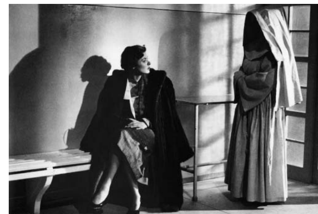
Europe 51 de Roberto Rossellini (Ponti-DeLaurentiis Cinematografica)

C'est dans le néoréalisme italien que les frères Dardenne puisent leur inspiration pour ces préoccupations éthiques. Luc Dardenne évoque l'importance d' Europe 51 de Roberto Rossellini (1952). Ce film raconte l'histoire d'une femme du monde dont l'enfant meurt suite à une tentative de suicide. Cette perte dont personne ne la blâme, mais dont elle se sent coupable, lui fait découvrir le monde autour d'elle, la misère de la classe ouvrière. Elle finit par abandonner son foyer pour s'occuper des gens simples qu'elle a rencontrés. Plusieurs éléments narratifs rapprochent les deux films. Tout comme Lorna,