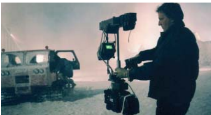
Garret Brown avec le steadicam sur le tournage de Shining