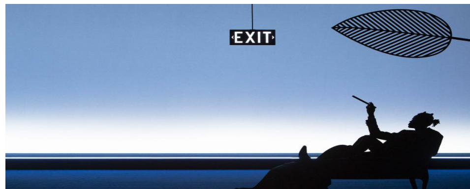
Junale Book, de Robert Wilson/CocoRosie