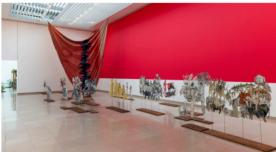
Anna Boghiguan. Vue de l'exposition au Carré d'art de Nîmes