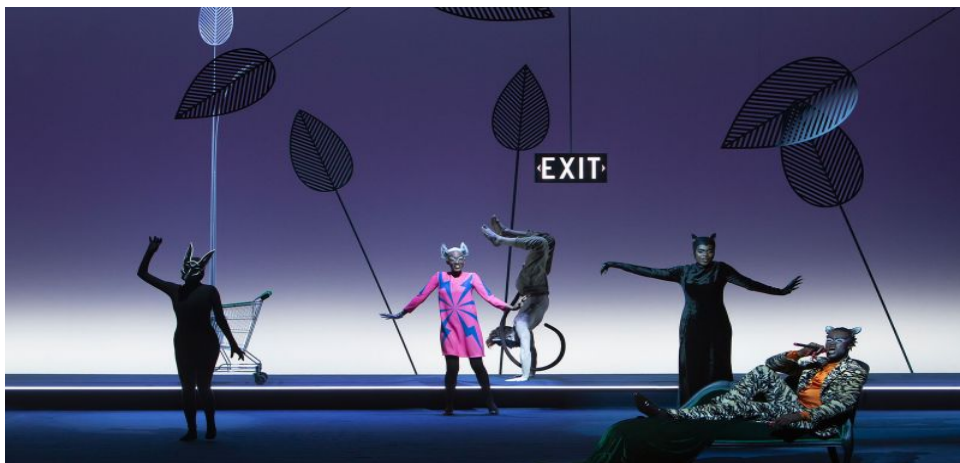
Junale Book, de Robert Wilson/CocoRosie

Les 22 et 23 octobre 2019 13 ème Art - Italie Deux