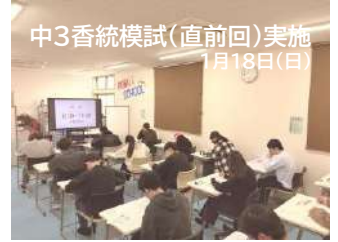
中3香統模試(直前回)実施 1月18日(日)