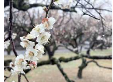
春告草(梅の花) @滝宮天満宮 2026.2.25