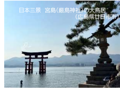
日本三景 宮島(厳島神社)の大鳥居 (広島県廿日市市)

もちろん、いつもの学習を継続していくことも重要です。特に受験生は重要な時期に差し掛かっています。毎日の学習習慣を維持し、目標に到達できるよう努力を続けましょう。中学校・高校では2学期中間テストの時期です。すでにテスト期間中の学校もありますが、これからテストが行われる生徒さんも含めて、テストに向けた対策を進めていきましょう。