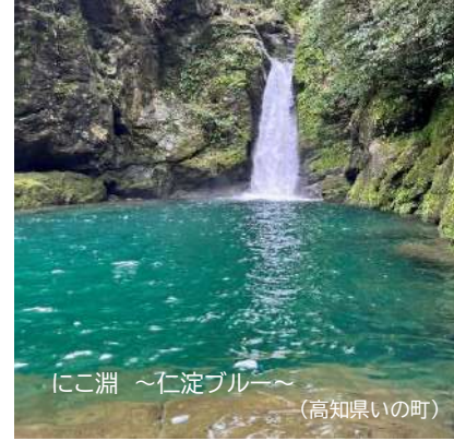
にこ淵 ~仁淀ブルー~