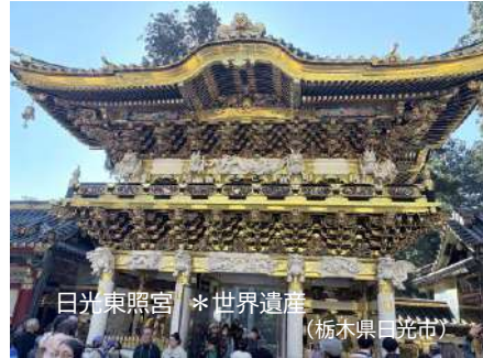
日光東照宮 *世界遺産