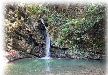
鮎返りの滝(三豊市財田町)

中3・高3受験生にとっては、受験に向けた重要な夏休みを迎えます。学習塾でもしっかりと学習時間を確保して、取り組んでもらいます。進路や今後の学習等について相談がありましたら、お申し出ください。