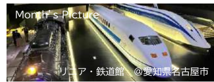
リニア・鉄道館 @愛知県名古屋市