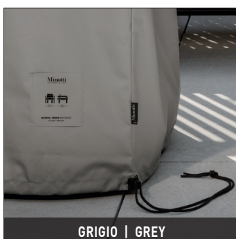
GRIGIO | GREY

La confection de la housse Rain Cover utilise un processus de termosoudage qui en garantit une imperméabilité totale. Pour le nettoyage, éviter l'utilisation de détergents agressifs même d'usage courant.