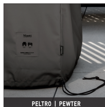
PELTRO | PEWTER