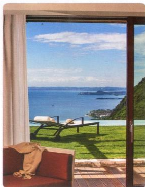
Всю стену в моем номере занимало раздвижное окно, из которого открывался вид на голубые воды озера Гарда.

М ы едем по горному серпантину из итальянского городка Сало, поднимаясь все выше и выше. Слева блестит серебром озеро Гарда и возвышаются Альпы, а легкие наполняет удивительный аромат, кажется, что этим воздухом невозможно надыхаться. Пункт нашего назначения — Lefay Resort & Spa. Научным комитетом Lefay Spa был создан метод, объединяющий принципы классической китайской медицины и современных западных технологий. Цель — достичь гармонии души и тела через восстановление энергии даже за короткий срок. Lefay Spa входит в число Healing hotels of the world — «целительных отелей мира».