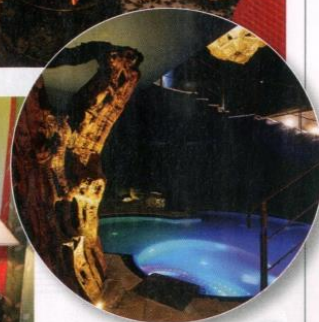
В озере с соленой водой La Luna nel Lago расслабляется тело и выводятся токсины

& Spa умудряются улучшить состояние здоровья, перестать нервничать по пустякам и примириться с несовершенством окружающей действительности всего за два дня пребывания. Но рассчитывающим на стойкий эффект придется задержаться здесь подольше, тем более если предстоит решить несколько проблем одновременно. Максимально восстановиться и буквально начать все сначала помогут пять базовых программ курорта: по похудению, по омоложению лица и тела, по корректировке осанки и нормализации сна, а также фитнес-программа. Если суметь пройти их все, можно считать себя заново рожденным. ● www.lefayresorts.com