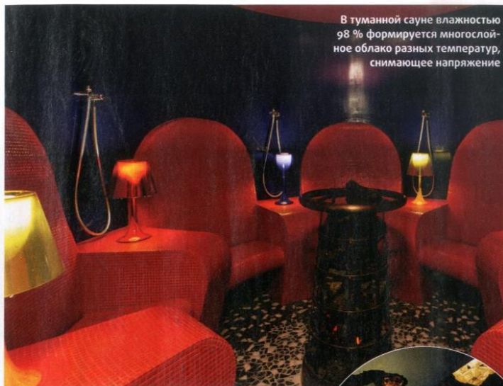
В туманной сауне влажностью 98 % формируется многослойное облако разных температур, снимающее напряжение

Благодаря столь серьезному подходу, некоторые гости Lefay Resort