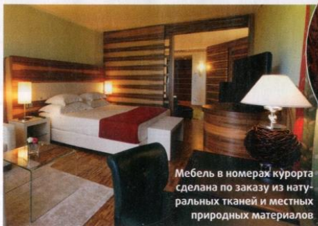
Мебель в номерах курорта сделана по заказу из натуральных тканей и местных природных материалов