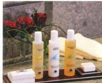
Основной ингредиент фирменной натуральной косметики Lefay Spa — оливковое масло