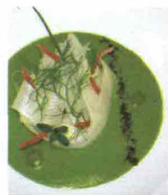
ZUPPA DI ASPARAGI VERDI E BIANCHI

Per 4 persone: 300 gr di asparagi verdi e 2 bianchi, 80 gr di patate, olio evo, una cipolla bianca, 300 ml di brodo vegetale, erbe aromatiche. Rosolare l'olio con la cipolla e gli asparagi pelati a tocchetti, aggiungere le patate a pezzetti e poi il brodo con le erbe. Cuocere per 10 minuti e frullare. Servire con una spolverata di carpaccio di asparagi bianchi (tagliati a julienne). Decorare con menta, santoreggia, aneto.