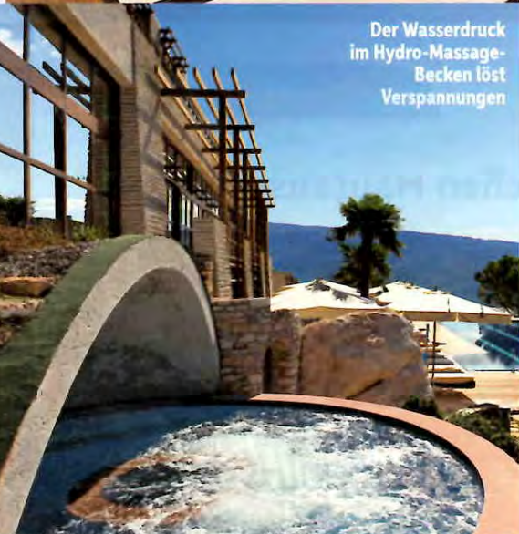
Der Wasserdruck im Hydro-Massage-Becken löst Verspannungen