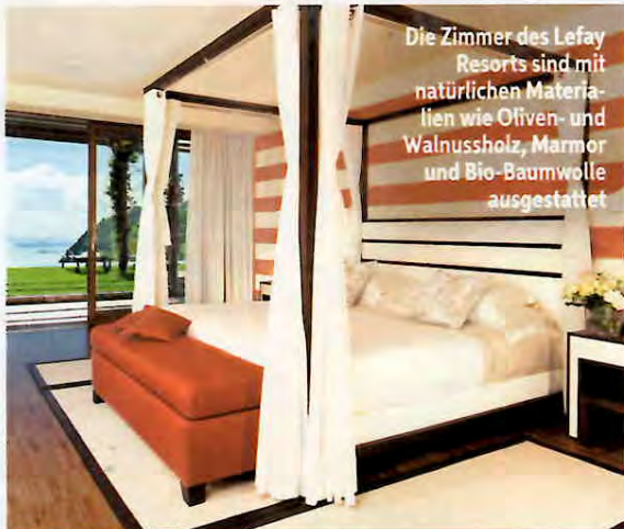
Die Zimmer des Lefay Resorts sind mit natürlichen Materialien wie Oliven- und Walnussholz, Marmor und Bio-Baumwolle ausgestattet