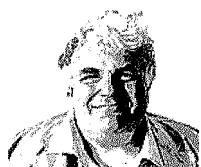
di Roberto Perrone

Chef, piatti, negozi: la cucina e gli Oscar del 2014 di «Scorribande»