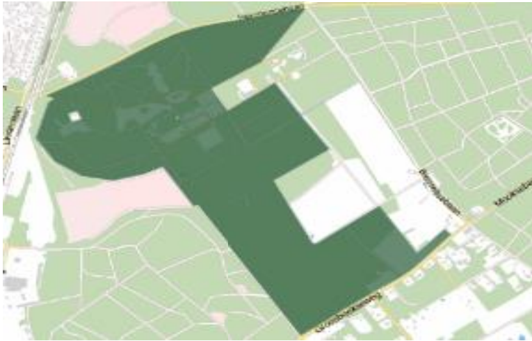
In donkergroen de percelen die als rijksmonument beschermd zijn.

Landgoed Jachtslot de Mookerheide is een verzameling van landschappelijke structuren, objecten en kenmerken uit verschillende tijdslagen, waarin het jachtslot centraal ligt. De geleidelijke ontwikkeling van Landgoed Jachtslot de Mookerheide heeft er toe geleid dat er veel verschillende tijdsperiodes met elk hun eigen kenmerken te ervaren zijn. De afleesbaarheid van deze geschiedenis is te beschouwen als een kwaliteit. Samenhang tussen de verschillende tijdsperiodes en de natuurlijke omgeving is niet sterk aanwezig, maar wel het bewuste resultaat van haar eerdere eigenaren. Dit kan ten aanzien van oriëntatie en beleving als een minpunt worden ervaren..