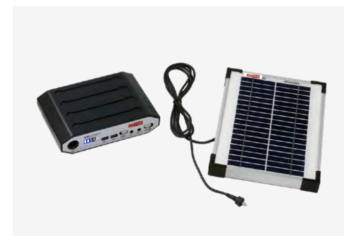
SOLPACK 2 NAPELEMES TÖLTŐ