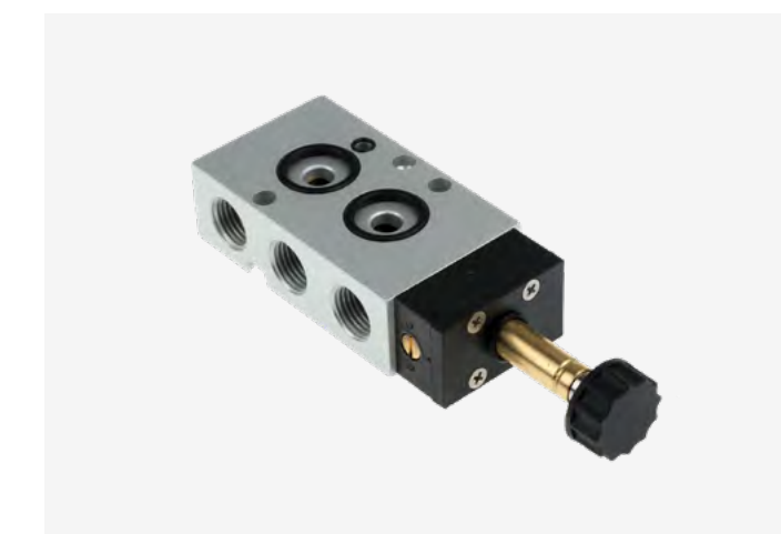
PNEUMATIKUS MÁGNESES VEZÉRLŐSZELEPEK