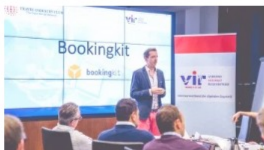
Dritte TIC & VIR Travel Start-up Night 2018 in Berlin 18. Mai 2018 In "Events"