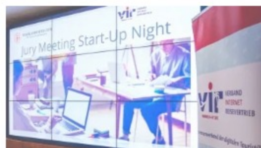
Die Bewerbung für einen Pitch während der Start-up Nights 15. Dezember 2017 In "News"