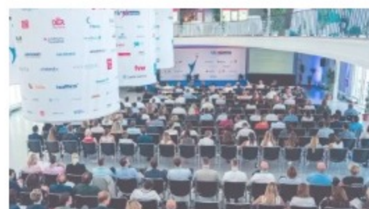
Ein Rückblick über die VIR Online Innovationstage 2018 22. Juni 2018 In "Events"