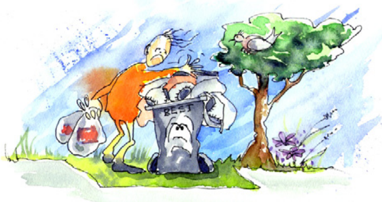
Illustrasjon av Solveig Andersen, IBOX AS, Stord NRF 06

Legg gjerne litt avisapir eller eggekartong i botnen av spannet. Avfall frå fisk og skaldyr kan frysast ned fram til hentedagen. Du kan dusje litt tynn eddikblanding over matavfallet for å unngå lukt. Hugs å knyte matavfallsposen godt igjen før du hiv den i spannet.