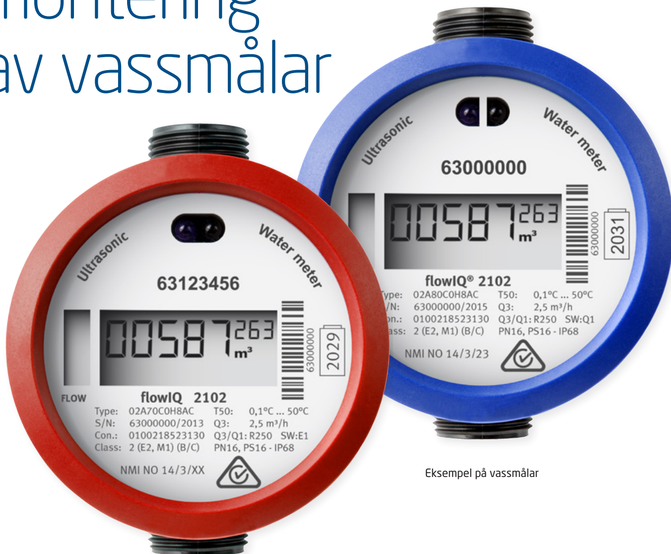
Eksempel på vassmålar