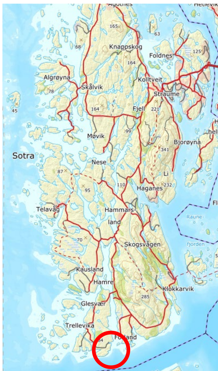
Figur 1. Lokalisering (raud ring):