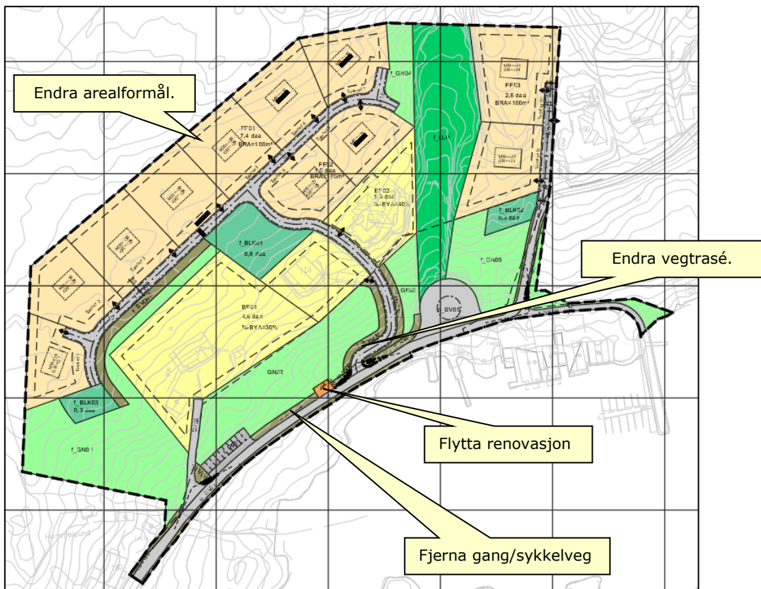
Figur 3. Forslag til reguleringsendring.