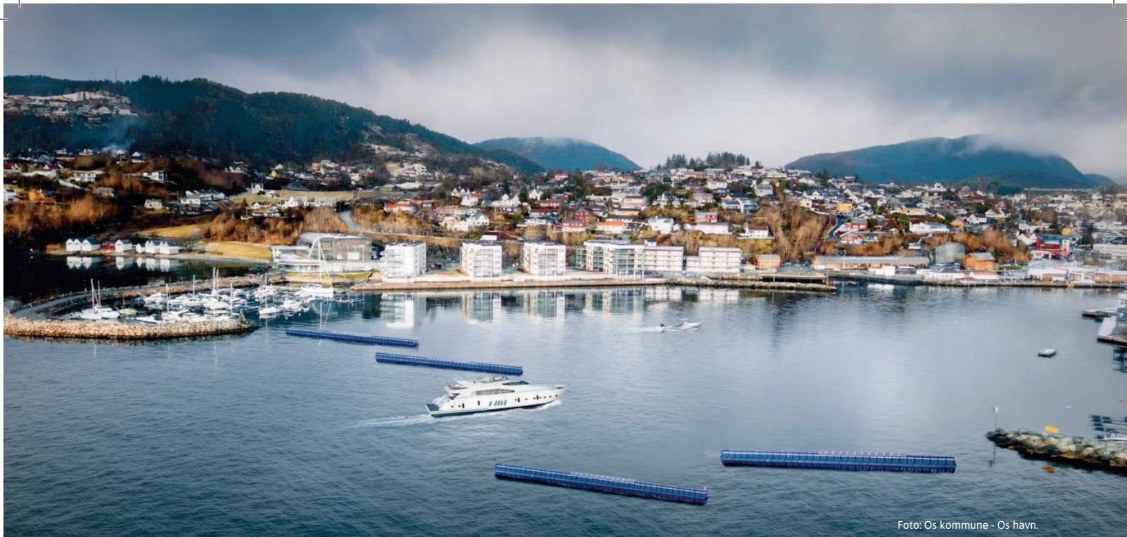
Os havn.