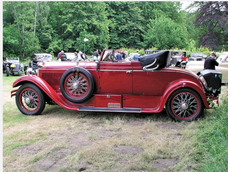
Minerva AF 30 CV Erdmann & Rossi, 1926

Nach dem ersten Weltkrieg wird Erdmann & Rossi einer der führenden Karosseriebauer in Europa. Man baut Karosserien zumeist auf Chassis von Premium-Fahrzeugen wie Bentley, Mercedes-Benz, Bugatti, Horch, Hispano-Suiza.