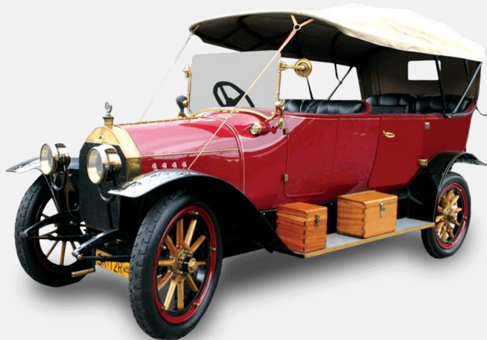
Mercedes 10/20 HP Erdmann & Rossi, 1912