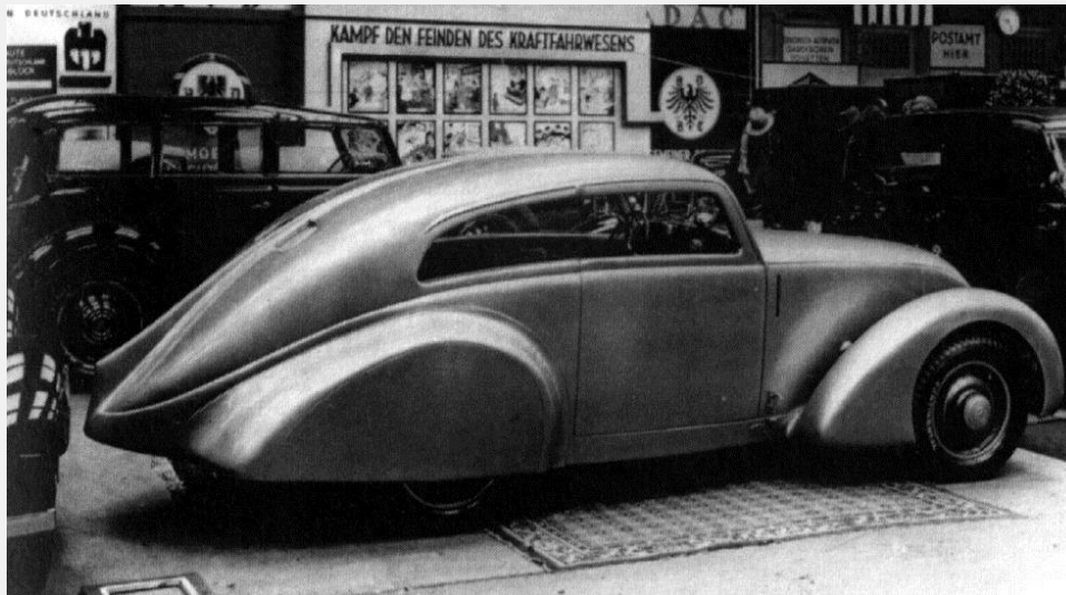
Mercedes-Benz Typ 170 Erdmann & Rossi, 1933