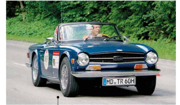
56 Karl-Heinz Ehrhardt und Wilhelmina de Vries Triumph TR 6 2498 ccm | 95 PS | 1972