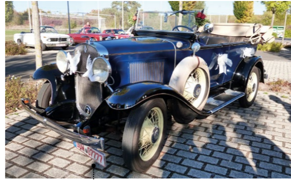
2 Robert und Gabi Braun Chevrolet Independence Phaeton (Series AE) 3179 ccm | 50 PS | 1930