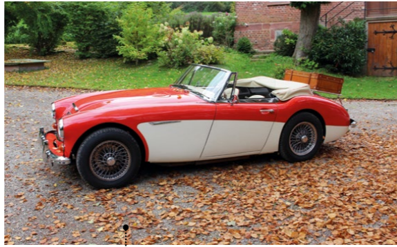
98 Erich Menk und Gudrun Raabe Austin Healey 3000 MK III (BJ8) 2912 ccm | 150 PS | 1964