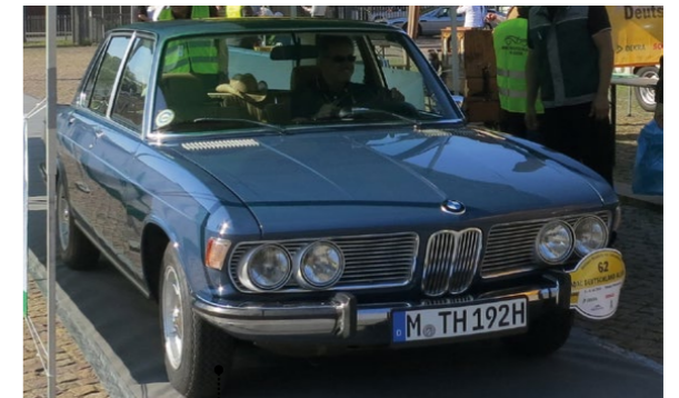
10 Mario und Ulrike Theissen BMW 2500 (E3) 2494 ccm | 150 PS | 1971