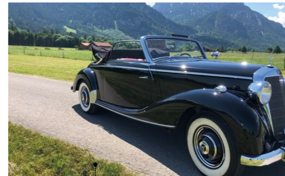
33 Helmut und Margaritha Angl Mercedes-Benz 170 S Cabriolet A (W 136 IV) 1767 ccm | 52 PS PS | 1950