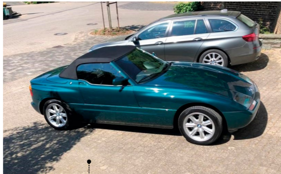
64 Peter Vaeßen und Martina Breuer Vaeßen BMW Z1 Roadster 2494 ccm | 170 PS | 1990