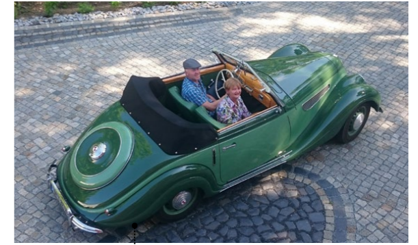
92 o Klaus und Michaela Borrmann EMW 327/2 Sport-Cabriolet 1991 ccm | 57 PS | 1953