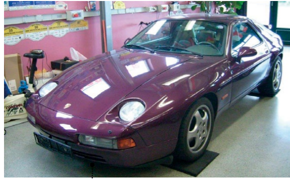
73 Edi Kopp und Karin Schlett-Kopp Porsche 928 GT3 5397 ccm | 350 PS | 1992