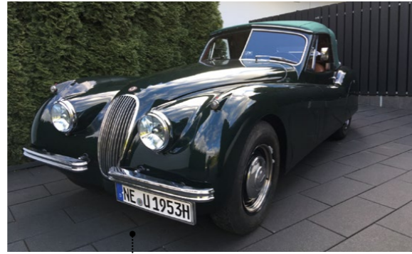
86 o Dieter Odendahl und Ulrike Odendahl-Schubert Jaguar XK 120 Drophead Coupè 3442 ccm | 160 PS | 1953