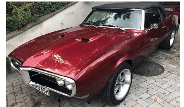
72 Werner und Andrea Oestreich Pontiac Firebird Convertible 5799 ccm | 265 SAE PS | 1968