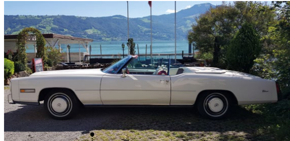
37 Peter Lütcke und Sabine Lütcke-Kühne Cadillac Fleetwood Eldorado Convertible Bicentennial Edition 8194 ccm | 190 PS | 1976