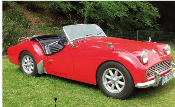
49 Manfred und Brita Kessebohm Triumph TR3 Sports (Type 20TR3) 2138 ccm | 101 PS | 1959