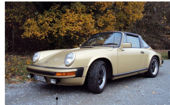
47 Rolf Thelen und Isolde Böhlinger-Thelen Porsche 911 SC 3.0 Targa 2992 ccm | 180 PS | 1977