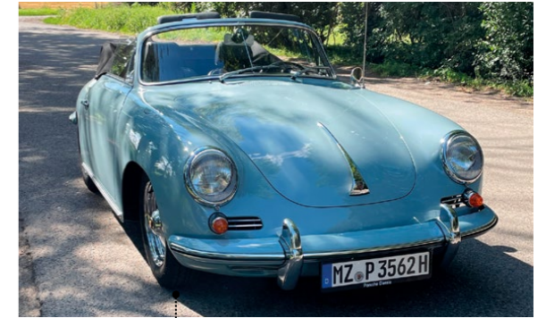
32 Klaus-Peter und Eveline Brickwedde Porsche 356 B - 1600 S Cabriolet 1582 ccm | 75 PS | 1962