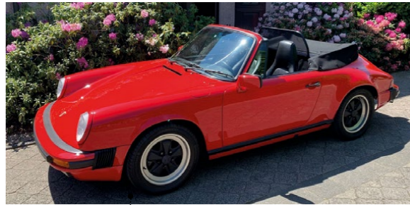
39 Burkhard und Birgit Petzold Porsche 911 Carrera 3.2 Cabriolet 3164 ccm | 218 PS | 1987