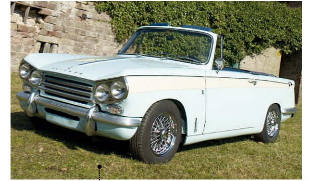
8 Rainer und Donate Bastuck Triumph Vitesse 2 Litre Convertible 1998 ccm | 95 PS | 1967