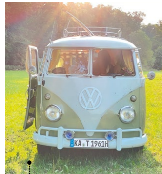
27 Steffen und Katharina Fritz VW-Campingwagen (SO 23) 1584 ccm | 90 PS | 1960