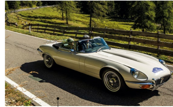
43 Wolfgang Höfler und Martina Hirschfeld Jaguar E-Type 5.3 Litre V12 Open Two-Seater 5343 ccm | 268 PS | 1974