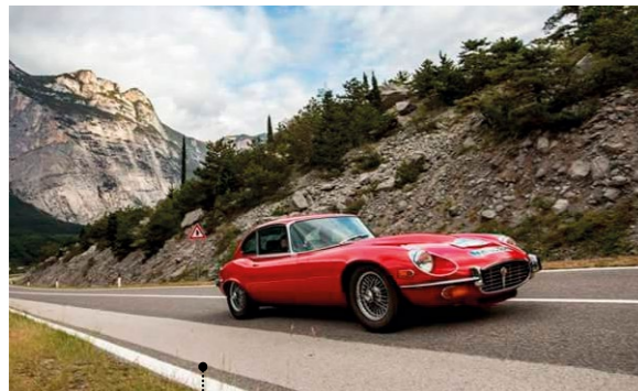
41 Gerd und Birgit Lenhart Jaguar E-Type Series 3 V12 2+2 5343 ccm | 250 PS | 1971