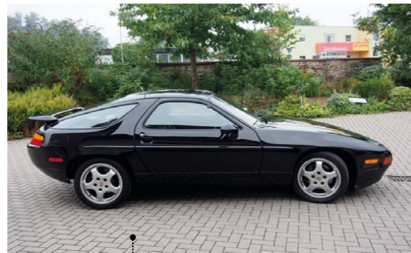
42 Roland Wojahn und Patricia Lauenroth Porsche 928 S4 4957 ccm | 320 PS | 1988