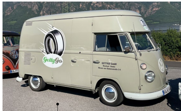
29 Tim Grünhage und Nadine Schnieder VW-Großraum-Kastenwagen (Typ 2) 1584 ccm | 60 PS | 1965