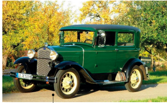
1 Eckart Wiesenhütter und Ilona Tilgner Ford Model A Tudor (55-A) 3288 ccm | 40 PS | 1928