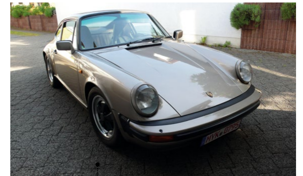
58 Ludwig Stiegler und Ulrike Walther Porsche 911 SC 3.0 Coupé 2992 ccm | 204 PS | 1982