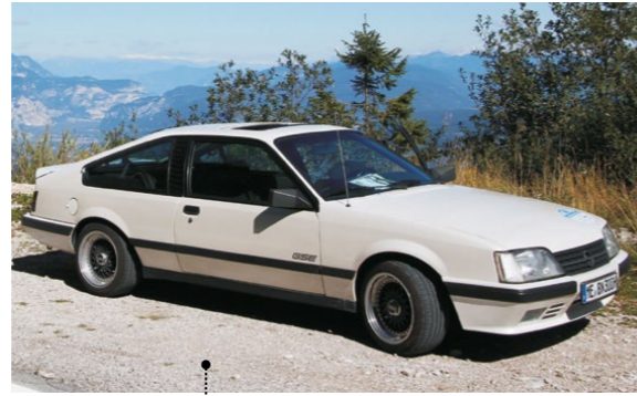
38 Norbert und Brigitte Keck Opel Monza GS/E 3801 ccm | 206 PS | 1986