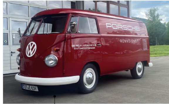
26 Heinrich und Sylvia Engesser VW Transporter Kasten (Typ 2) 1584 ccm | 64 PS | 1961