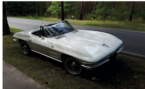
90 o Manfred Nitsche und Evelin Robota Chevrolet Corvette Stingray Convertible (C2) 5358 ccm | 365 SAE PS | 1964