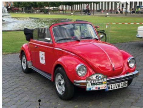
89 o Wolfgang Kohlmann und Barbara Hilse VW 1303 LS Cabriolet (Typ 15) 1584 ccm | 50 PS | 1976