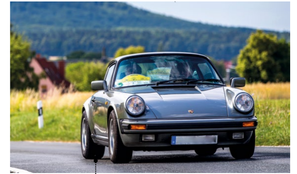
22 • Gerd und Petra Wilsdorf Porsche 911 Carrera 3.2 Coupè 3164 ccm | 207 PS | 1988