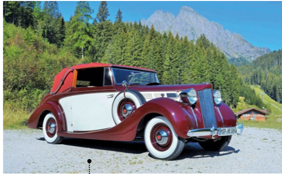
50 Richard und Hedwig Hußenether Packard Six Convertible Coupé 4015 ccm | 100 PS | 1938