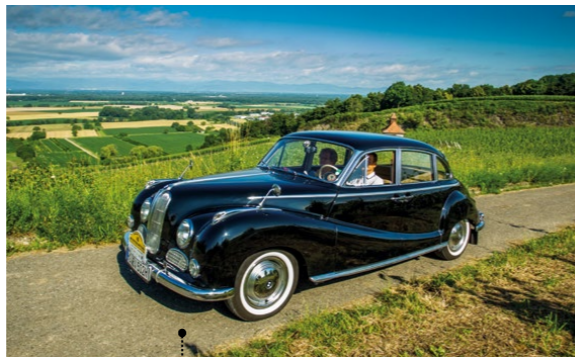
18 • Werner und Helga Hahn BMW 502 Limousine 2580 ccm | 100 PS | 1955