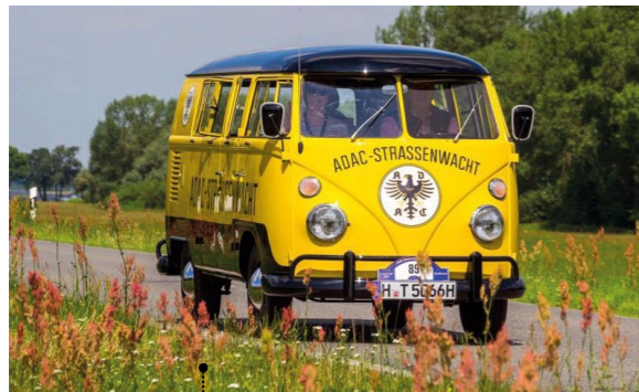
77 Ulrich und Silvia Krämer VW Transporter 1500 Kombi (Typ 23) 1584 ccm | 65 PS | 1964