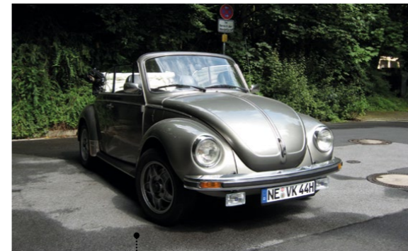
35 Volker Kaul und Margarete Lennartz VW 1303 Cabriolet (Typ 15) 1584 ccm | 50 PS | 1979