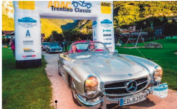
102 Georg und Sigrid Maier Mercedes-Benz 300 SL Roadster (W 198 II) 2996 ccm | 215 PS | 1957