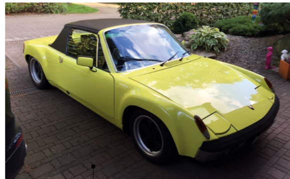
4 Günter Steinmeier und Gudrun Berg Steinmeier Porsche 914/6 1991 ccm | 110 PS | 1972