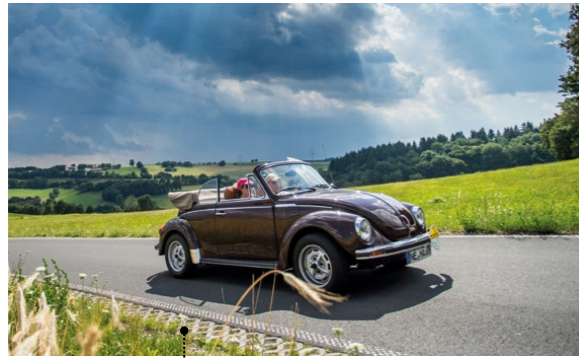
15 • Elena Schleupen und Alexander Austmann VW 1303 LS Cabriolet (Typ 15) 1584 ccm | 50 PS | 1976