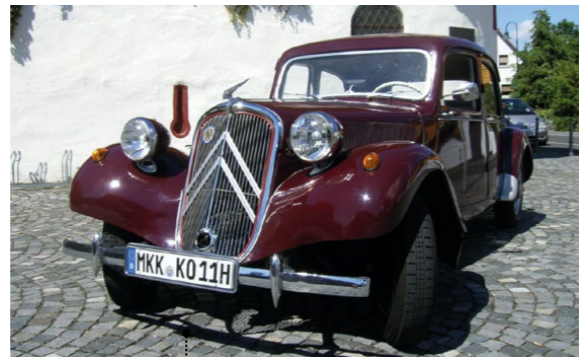
6 Kurt und Waltraud Oehm Citroën Traction Avant 11 B Légère Berlina 1911 ccm | 56 PS | 1954