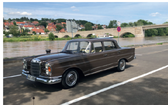
19 Michael Schmirldorfer und Monika Bauer Mercedes-Benz 220 Sb (W 111/2) 2196 ccm | 110 PS | 1963