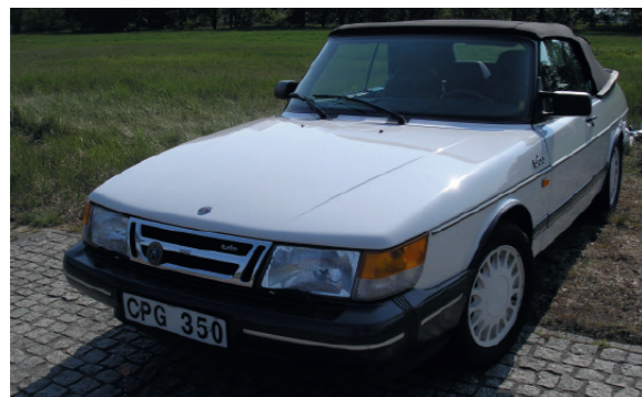
o Wolfgang Schwenk und Barbara Trettin Saab 900 Cabriolet 85 1985 ccm | 118 PS | 1987