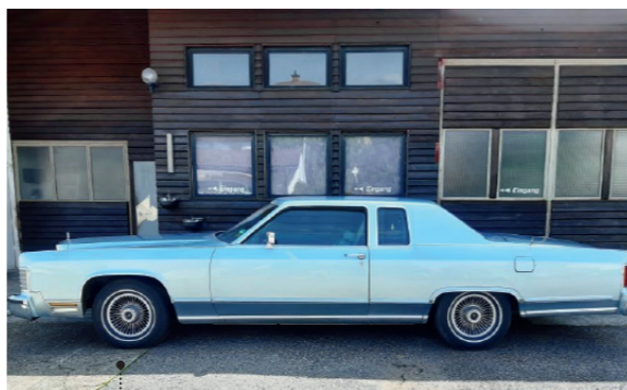
o Wolfgang Weigelt und Lydia Ullmann 30 Lincoln Continental Town Coupé 6590 ccm | 159 PS | 1979