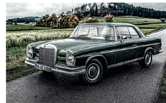
12 Rainer und Regina Kloss Mercedes-Benz 300 SE Coupé (W 112/3) 2996 ccm | 170 PS | 1967