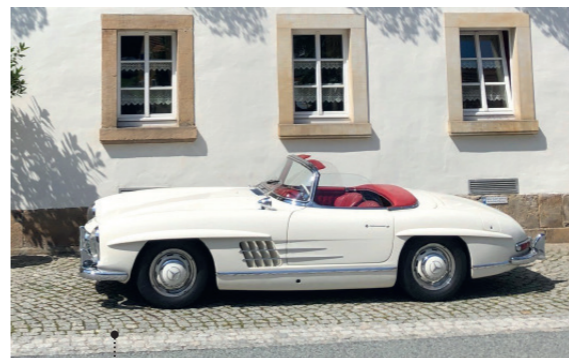
o Robert und Elke Zimmermann Mercedes-Benz 300 SL Roadster (W 198 II) 91 2996 ccm | 215 PS | 1960