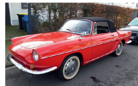
Renault Caravelle 1100 S Cabriolet (R 1133) 48 1108 ccm | 52 PS | 1965