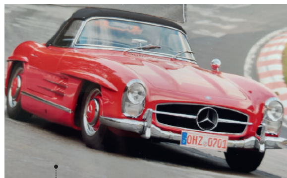
o Jörg Landgraf und Gitta von Schassen 27 Mercedes-Benz 300 SL Roadster (W 198 II) 2996 ccm | 215 PS | 1957