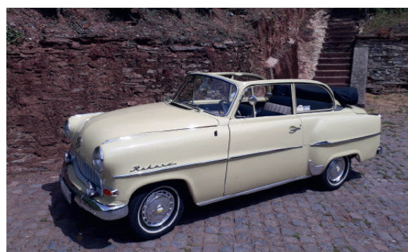
17 Klaus und Dagmar Kunz Opel Olympia Rekord Cabriolet-Limousine (Olympia-55) 1488 ccm | 45 PS | 1956