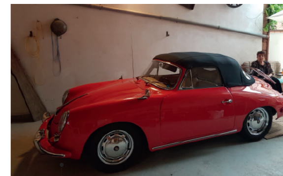
o Lothar M. und Ingrid Hawel Porsche 356 C - 1600 SC Cabriolet 94 1582 ccm | 95 PS | 1965