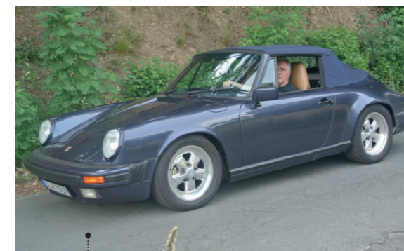
o Helmut Brocke Porsche 911 Carrera 3.2 Cabriolet 72 3164 ccm | 207 PS | 1986