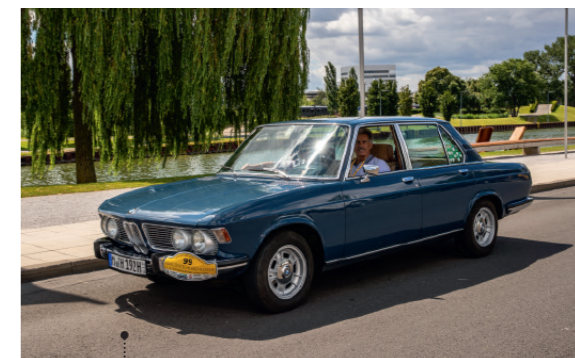
10 Mario und Ulrike Theissen BMW 2500 (E3) 2494 ccm | 150 PS | 1971