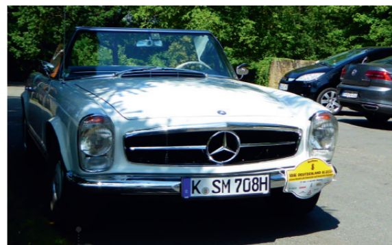
33 Mercedes-Benz 230 SL (W 113) 2307 ccm | 150 PS | 1965