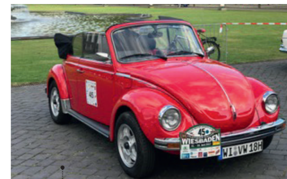
o Wolfgang Kohlsmann und Barbara Hilse 82 VW 1303 LS Cabriolet (Typ 15) 1584 ccm | 50 PS | 1976