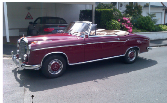
13 Horst und Gudrun Lehmbach Mercedes-Benz 220 S Cabriolet (W 180 II) 2195 ccm | 100 PS | 1956