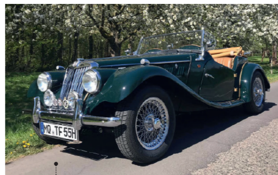
o Matthias und Elke Klüber 81 MG TF 1500 Midget 1466 ccm | 63 PS | 1955