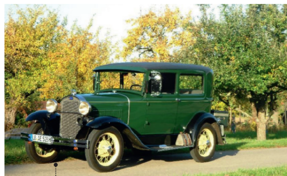
3 Eckart Wiesenhütter und Ilona Tilgner Ford Model A Tudor (55-A) 3288 ccm | 40 PS | 1928