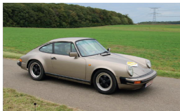
o Ludwig Stiegler und Ulrike Walther Porsche 911 SC 3.0 Coupé 2992 ccm | 204 PS | 1982