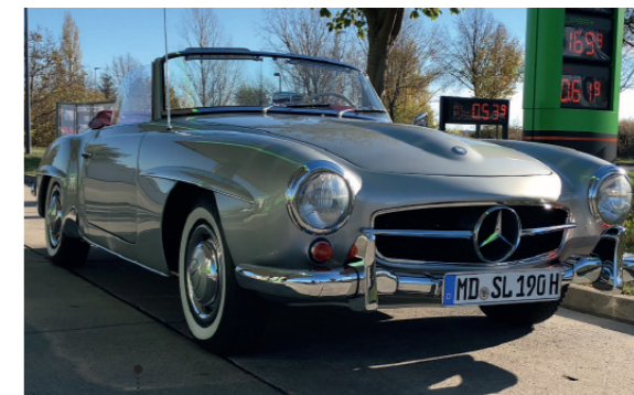
o Peter Krolopp und Dorrit Meyer-Krolopp Mercedes-Benz 190 SL Coupé (W 121) 1,897 ccm | 105 PS | 1960