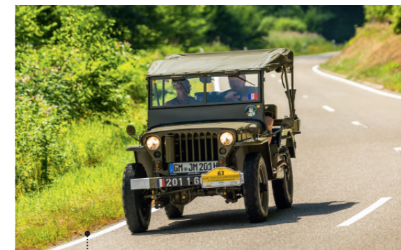
o Harald Hänsel und Karina Bayer 80 Hotchkiss Type M 201 4x4 2196 ccm | 60 PS | 1958