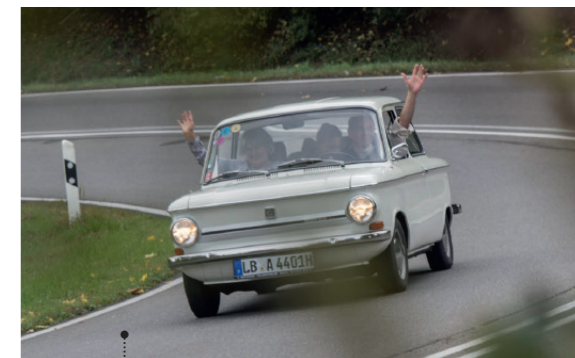
8 Georg und Ursula Müller NSU Prinz 4 L (Typ 47) 598 ccm | 30 PS | 1970