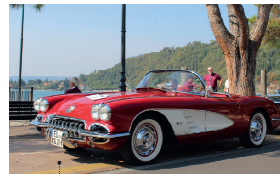
o Reinhard und Vera Gabler 36 Chevrolet Corvette Convertible (C1) 4645 ccm | 230 PS | 1960