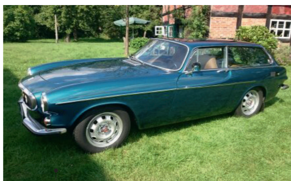
o Eckard Roczen und Bettina Kruck Volvo P 1800 ES 40 1986 ccm | 124 PS | 1972