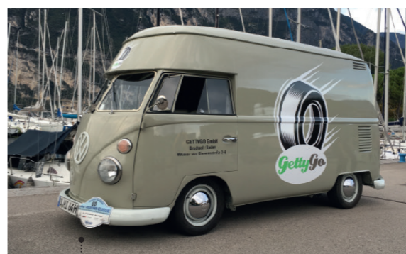
23 Friedhelm und Micha Lenhart Gettygo GmbH VW-Großraum-Kastenwagen (Typ 2) 1548 ccm | 60 PS | 1965