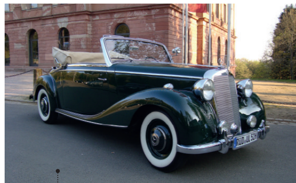
o Karl und Ursula Lehmann Mercedes-Benz 170 S Cabriolet A (W 136 IV) 37 1767 ccm | 52 PS | 1951