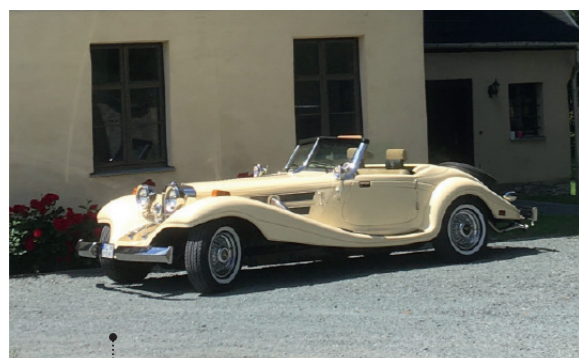
o Klaus und Ursula Walther Heritage 500 K 39 5733 ccm | 180 PS | 1990