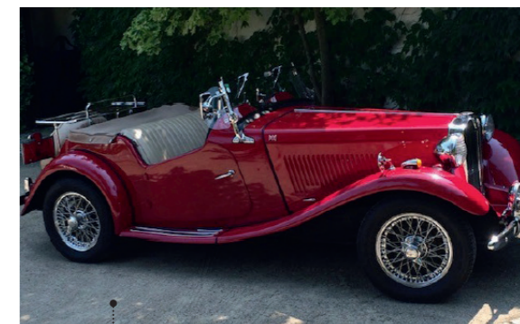
o Ehrenfried und Waltraud Piele MG TD 70 1250 ccm | 54 PS | 1951