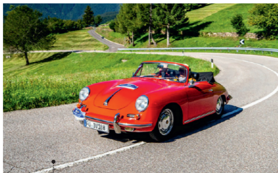
o Karl-Heinz Ehrhardt und Wilhelmina de Vries 26 Porsche 356 C - 1600 C Cabriolet 1582 ccm | 75 PS | 1964