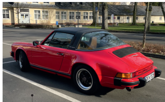
o Karl-Heinz Baringhaus 73 Porsche 911 SC - 3.0 Targa 2994 ccm | 180 PS | 1979