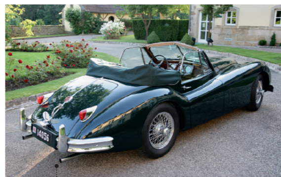
o Jules Tibolt und Sylvie Walisch Jaguar XK 140 SE Drophead Coupé 3442 ccm | 170 PS | 1956