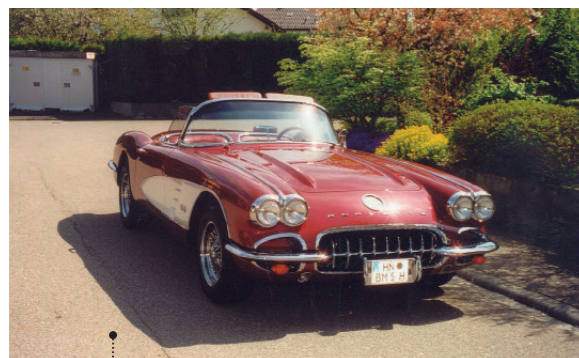
o Werner und Inge Beiermeister Chevrolet Corvette Convertible (C1) 4645 ccm | 230 PS | 1960