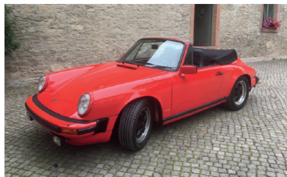
o Manfred und Brita Kessebohm 75 Porsche 911 SC 3.0 Cabriolet 2994 ccm | 204 PS | 1983