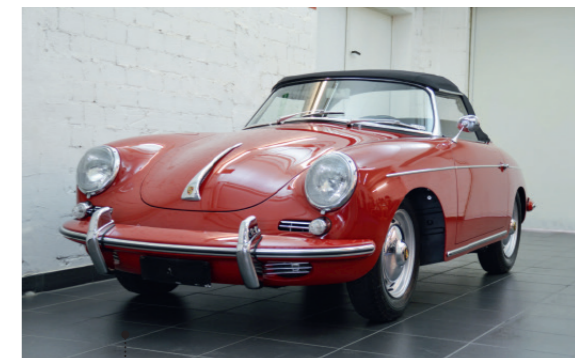
o Thomas und Ah Young Scholdra Porsche 356 B - 1600 Super 90 Roadster 92 1582 ccm | 90 PS | 1961