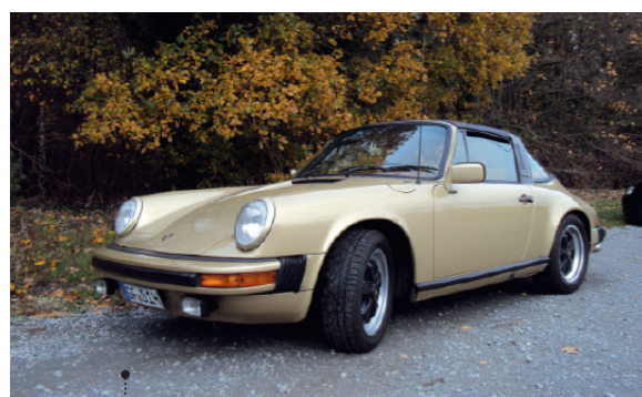
o Rolf Thelen und Isolde Böhlinger-Thelen Porsche 911 SC 3.0 Targa 41 2992 ccm | 180 PS | 1977