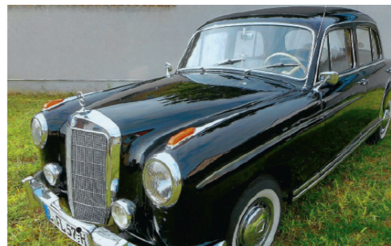
o Dietmar und Ingrid Schubert Mercedes-Benz 220 S Limousine (W 180 II) 2196 ccm | 100 PS | 1957