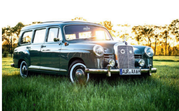
o Udo Goetz und Frauke Seewald Mercedes-Benz 180 D-Am Kombinationswagen (W 120 D I) 42 1767 ccm | 43 PS | 1956