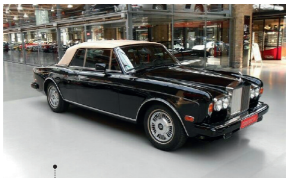
o Hans-Dieter Kessler und Heike Hartmannshenn 76 Rolls-Royce Corniche Convertible 6750 ccm | 225 PS | 1992