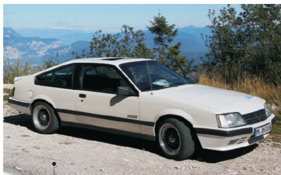
o Norbert und Brigitte Keck 28 Opel Monza-A GS/E 3801 ccm | 206 PS | 1986