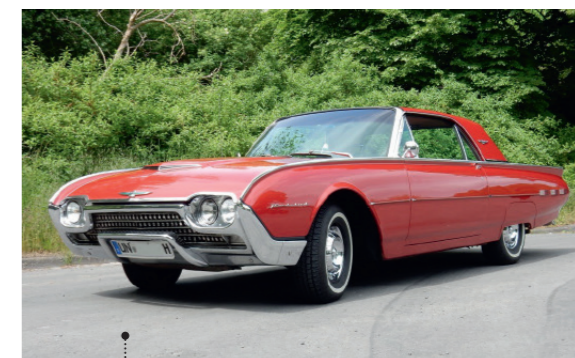
o Ludwig und Gaby Brümmer Ford Thunderbird 2-door Hardtop Coupé 6396 ccm | 304 PS | 1962