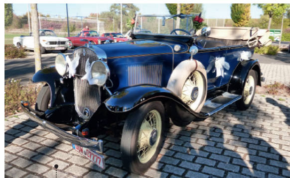
1 Robert und Gabi Braun Chevrolet Independence Phaeton (Series AE) 3179 ccm | 50 PS | 1930