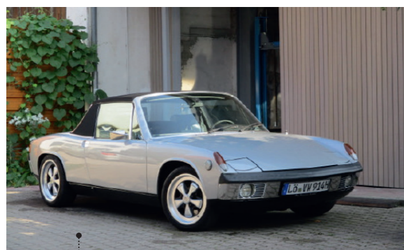
15 Franz und Susanne Buettner Porsche 914/6 3164 ccm | 231 PS | 1970