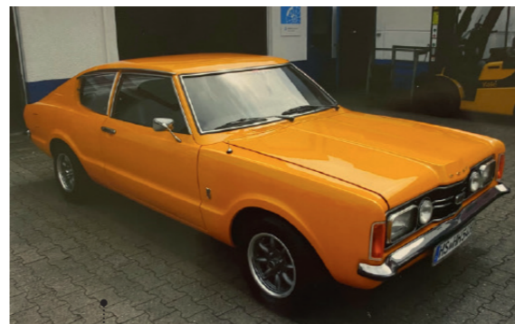
o Helmut und Helga Heß 79 Ford Taunus TC 1600 GT Coupé 1576 ccm | 88 PS | 1971