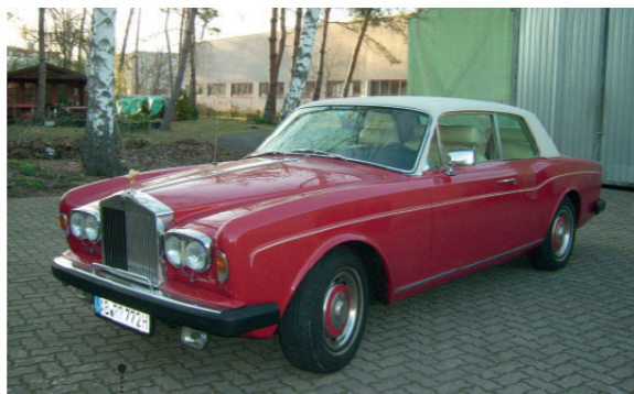
o Edi Kopp und Karin Schlett-Kopp 74 Rolls-Royce Corniche Coupé 6750 ccm | 190 PS | 1977