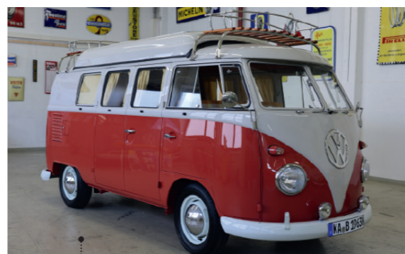
21 Steffen und Tanja Fritz Gettygo GmbH VW-Campingwagen (SO 36) 1593 ccm | 50 PS | 1963