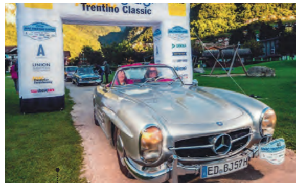
33 Georg und Sigrid Maier Mercedes-Benz 300 SL Roadster (W198 II) 2996 ccm | 215 PS | 1957