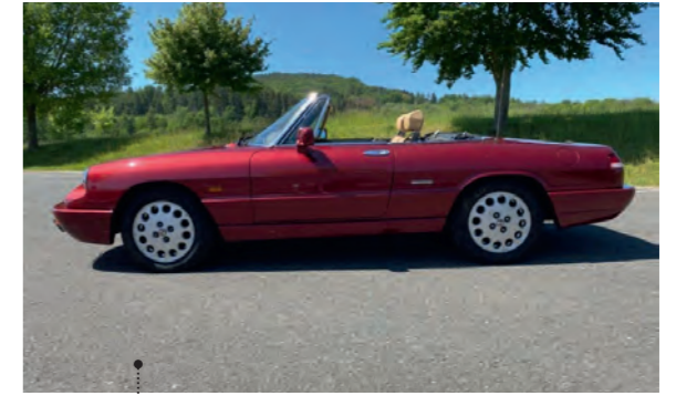
26 Rainer Nicolas und Cordula Weider Alfa Romeo Spider 2.0 1975 ccm | 120 PS | 1990