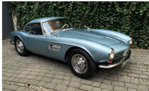
59 Thomas und Ah Young Scholdra BMW 507 Touring Sport 3186 ccm | 160 PS | 1957