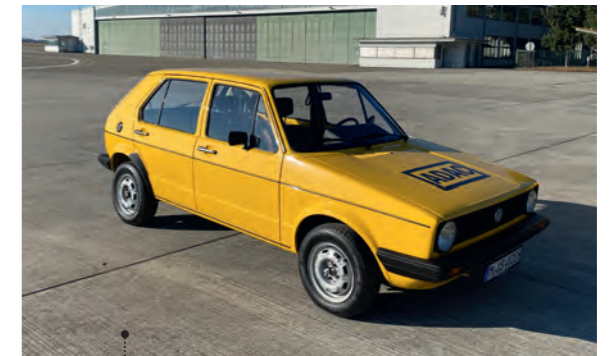
52 Team Pirelli VW Golf C 1.6D (Typ 17) 1588ccm | 54 PS | 1983