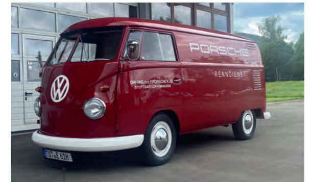
18 o Heinrich und Sylvia Engesser VW-Kastenwagen (Typ 21) 1584 ccm | 64 PS | 1961