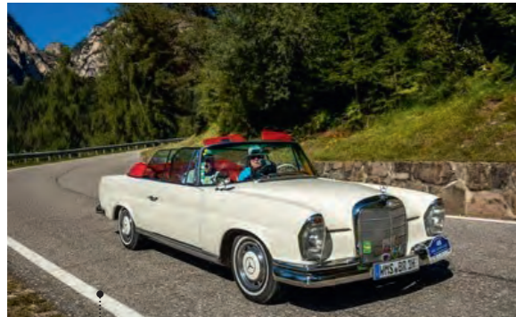
57 Bernd Rothämel und Siegfried Zander Mercedes-Benz 220 SE b Cabriolet (W111/3) 2196 ccm | 120 PS | 1962