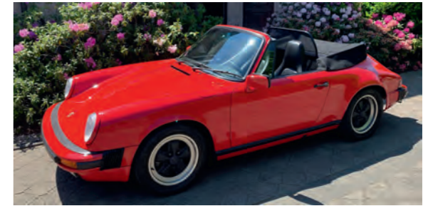
64 Burkhard und Birgit Petzold Porsche 911 Carrera 3.2 Cabriolet 3164 ccm | 218 PS | 1987