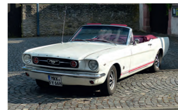
6 Bernd Schneider und Nicole Oehm-Schneider Ford Mustang GT 289 Convertible 4728 ccm | 200 PS | 1966