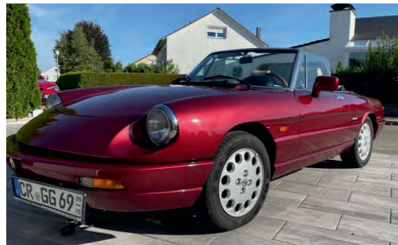
11 o Gunther Gropper und Wiltrud Jarsen-Gropper Alfa Romeo Spider 2.0 1962 ccm | 120 PS | 1992