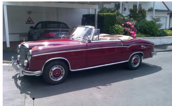
35 Horst und Gudrun Leimbach Mercedes-Benz 220 S Cabriolet (W 180 II) 2196 ccm | 115 PS | 1956