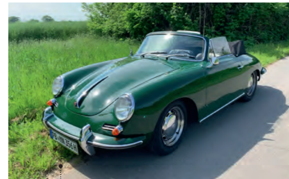
39 Karl und Marly Niggemeyer Porsche 356 C - 1600 SC Cabriolet 1582 ccm | 95 PS | 1965