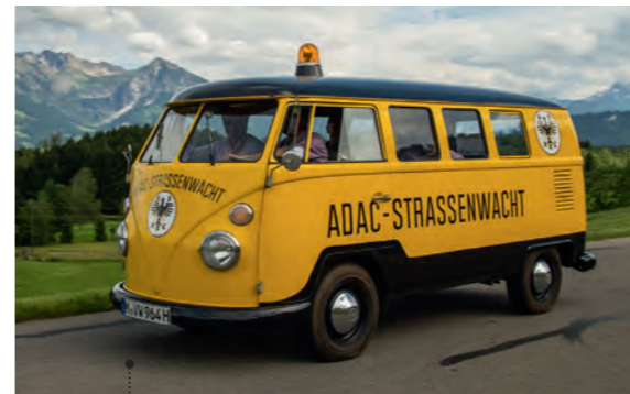
15 o ADAC Klassik Bewohner des Samariterbund Wohnhauses in Bad Ischl VW Transporter 1500 Kombi (Typ 2) 1493 ccm | 42 PS | 1964