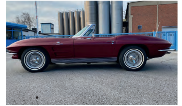
38 Elmar und Nicole Wagenbach Chevrolet Corvette Sting Ray Convertible (C2) 5354 ccm | 340 SAE PS | 1963