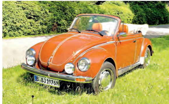
21 Axel Quittkat und Veronika Wiese VW 1303 LS Cabriolet (Typ 15) 1584 ccm | 50 PS | 1974