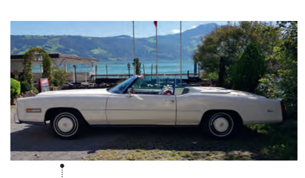
42 Peter Lütchke und Sabine Lütchke-Kühne Cadillac Fleetwood Eldorado 8194 ccm | 190 PS | 1976