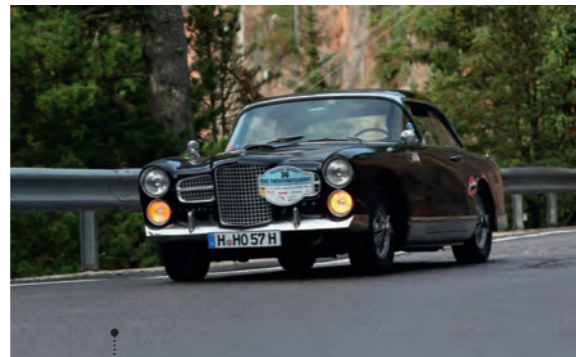
36 Karsten Höhns und Denise Pape Facel Vega FV 3B 4940 ccm | 254 PS | 1957