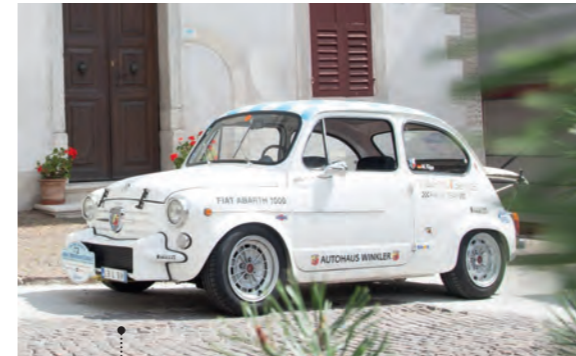
27 Michael und Jutta Kipp Fiat 600D 982 ccm | 70 PS | 1963