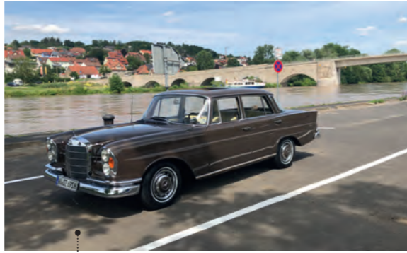
56 Michael Schmirdorfer und Monika Bauer Mercedes-Benz 220 Sb (W 111/2) 2196 ccm | 110 PS | 1963