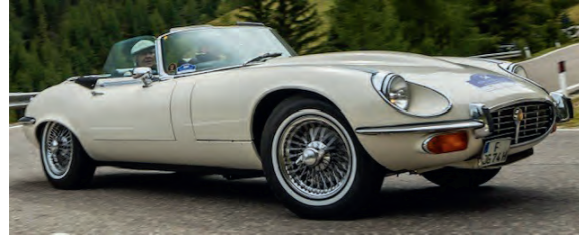
31 Wolfgang Höfler und Martina Hirschfeld Jaguar E-Type Series 3 V12 Open Two-Seater 5344 ccm | 267 PS | 1974