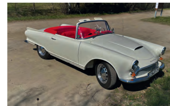
2 Reinhard und Rosemarie Pfau Auto Union 1000 Sp Roadster (F95) 981 ccm | 55 PS | 1963