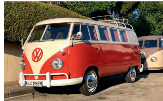
17 o Steffen und Tanja Fritz VW-Campingwagen SO 23 (T1) 1584 ccm | 50 PS | 1960