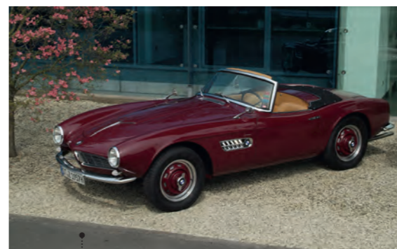
3 Manfred Feldhaus und Monika Brochtrup BMW 507 Touring Sport 3169 ccm | 140 PS | 1957