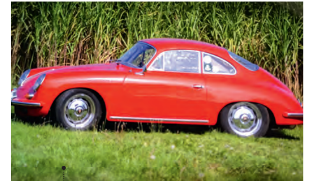
28 Peter und Carla Boecking Porsche 356 B - 1600 Coupé 1582 ccm | 75 PS | 1962