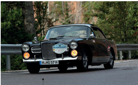
43 o Karsten Höhns und Nina Henze Facel Vega FV 3 4527 ccm | 200 PS | 1956