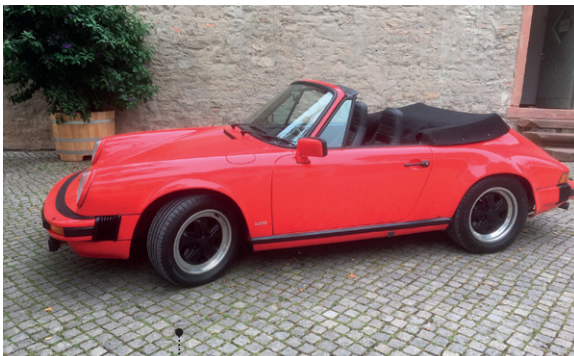
31 Brita und Manfred Kessebohm Porsche 911 SC 3.0 Cabriolet 2994 ccm | 204 PS | 1983