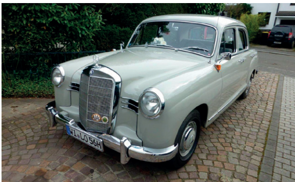
69 Lothar Katnawatos und Lothar Henneberg Mercedes-Benz 190 (W 121 B) 1897 ccm | 75 PS | 1956