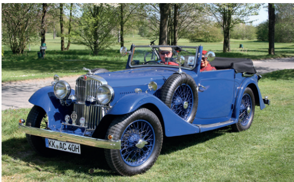
21 Dieter Krawczyk und Christina Krawczyk-Aguilar AC 16/70 Drophead Coupé 1991 ccm | 70 PS | 1936