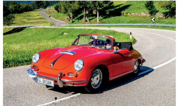
30 Karl-Heinz Ehrhardt und Wilhelmina de Vries Porsche 356 C - 1600 C Cabriolet 1582 ccm | 75 PS | 1964