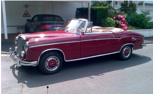
o Horst und Gudrun Leimbach 83 Mercedes-Benz 220 S Cabriolet (W 180 II) 2195 ccm | 115 PS | 1956