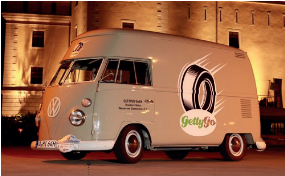
17 Mike Zobel und Janine Borchert VW-Großraum-Kastenwagen (Typ 2) 1548 ccm | 60 PS | 1965