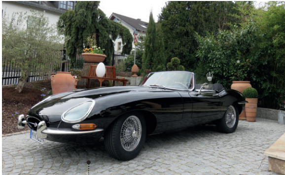
47 Hans-Jürgen und Gudrun Gebauer Jaguar E-Type 3.8 Litre Open Two-Seater 3781 ccm | 265 (SAE) PS | 1964