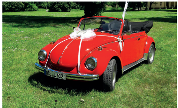
68 Hans-Jürgen Lux und Jens Richter VW 1302 LS Cabriolet (Typ 15) 1192 ccm | 34 PS | 1971