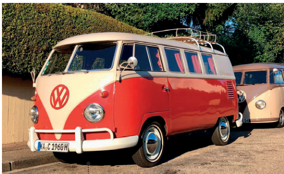
15 o Steffen und Tanja Fritz VW-Campingwagen SO 23 (T1) 1584 ccm | 50 PS | 1960