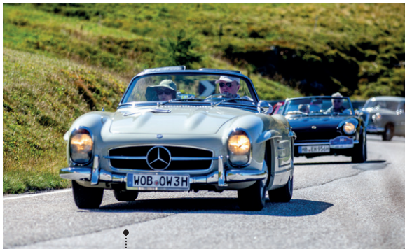
o Otto Ferdinand und Katharina Wachs 73 Mercedes-Benz 300 SL Roadster (W 198 II) 2996 ccm | 215 PS | 1961