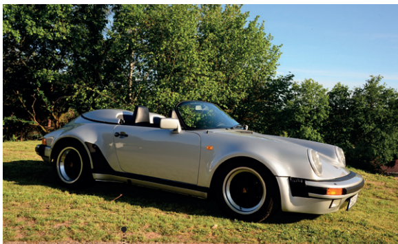
39 o Peter und Sybille Schuler Porsche 911 Carrera 3.2 Speedster 3164 ccm | 231 PS | 1988