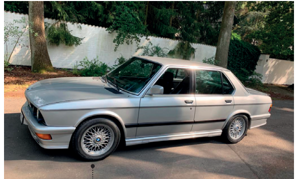
42 o Reinhart und Cornelia Stierner BMW M5 (E28) 3453 ccm | 285 PS | 1987