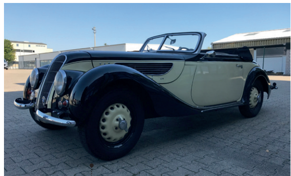
22 Helmar und Fatima Broich BMW 327/28 Sport-Cabriolet (Typ 327/8) 1991 ccm | 80 PS | 1938