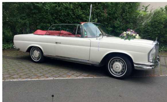
o Bernd und Heidi Rothämel 76 Mercedes-Benz 220 SE b Cabriolet (W 111/3) 2195 ccm | 120 PS | 1962