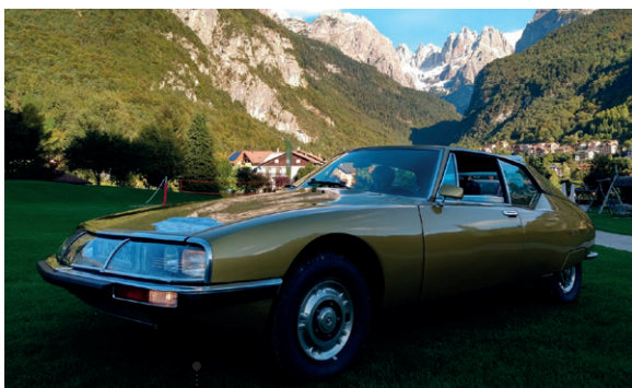
27 Gunther Gropper und Wiltrud Jarsen Gropper Citroën SM Injection 2670 ccm | 175 PS | 1973