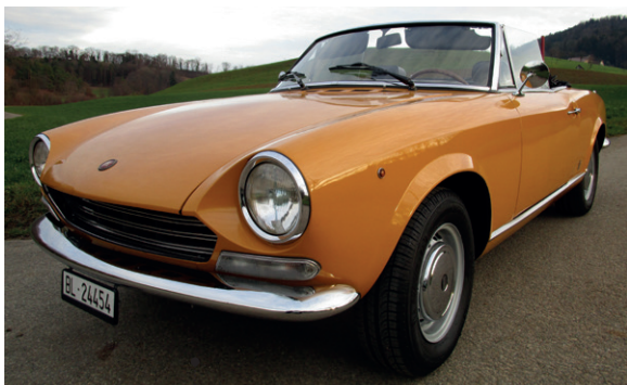
63 o Peter und Ursula Gisin Fiat 124 Sport Spider (Tipo 124 AS) 1438 ccm | 90 PS | 1969