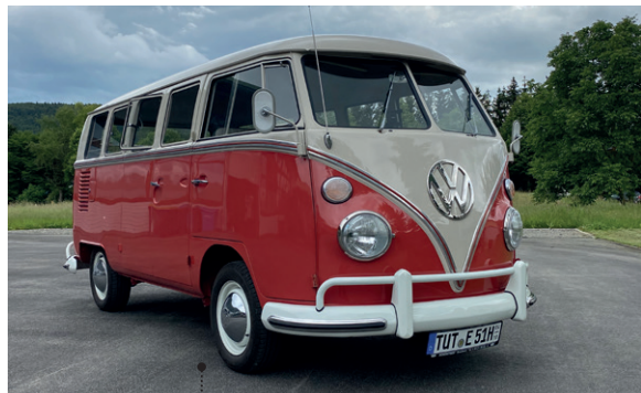
26 Heinrich und Sylvia Engesser VW-Siebensitzer Sondermodell 1500 (Typ 24) 1493 ccm | 42 PS | 1965