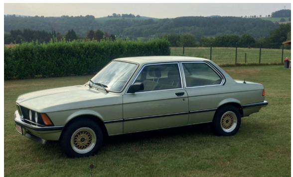
58 Rainer Nicolas und Cordula Weider BMW 316 (E21) 1754 ccm | 90 PS | 1981