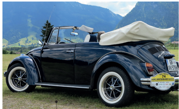
20 Heinz und Heidrun Fringes VW 1500 Cabriolet (Typ 15) 1493 ccm | 44 PS | 1970