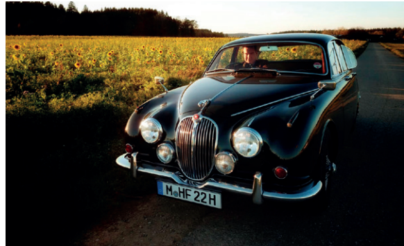
o Hans-Friedrich Fuge und Torsten Böhler 72 Jaguar 240 2483 ccm | 135 PS | 1968