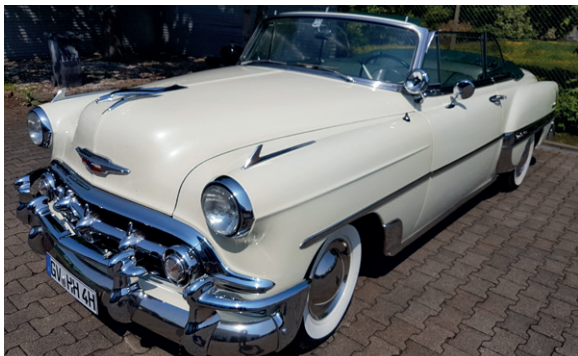
61 o Helmut und Elke Haubert Chevrolet Bel Air Convertible 3860 ccm | 115 (SAE) PS | 1953