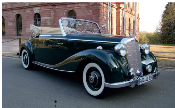
4 Karl und Ursula Lehmann Mercedes-Benz 170 S Cabriolet A (W 136 IV) 1767 ccm | 52 PS | 1951