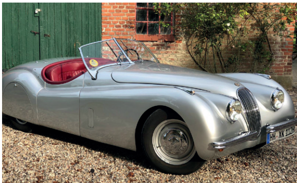
49 Axel Löhde und Corinne Haus-Löhde Jaguar XK 120 Open Two-Seater 3442 ccm | 160 PS | 1951