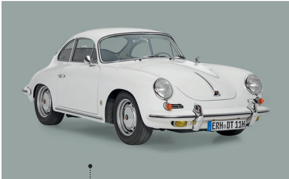
53 Thomas und Doris Frank Porsche 356 C - 1600 C Coupé 1582 ccm | 75 PS | 1964