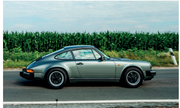
6 Gerd und Petra Wilsdorf Porsche 911 Carrera 3.2 Coupé 3164 ccm | 207 PS | 1988