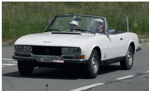
64 o Marcel und Rita Durrer Peugeot 504 Cabriolet (B12) 1970 ccm | 106 PS | 1978