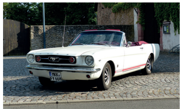
8 Bernd Schneider und Nicole Oehm-Schneider Ford Mustang Convertible 4728 ccm | 200 PS | 1966