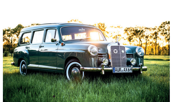
34 Udo Goetz und Frauke Seewald Mercedes-Benz 180 D-Am Kombinationswagen (W 120 D I) 1767 ccm | 43 PS | 1956