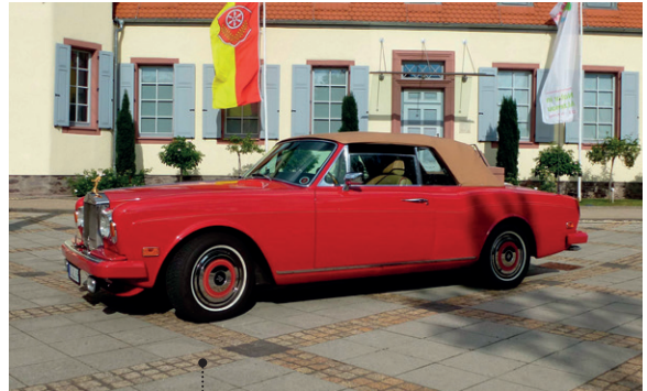
66 Edi Kopp und Karin Schlett-Kopp Rolls-Royce Corniche Convertible 6750 ccm | 173 PS | 1972