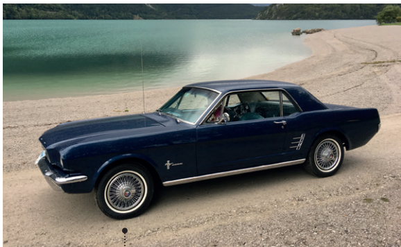
25 Helmut und Gita Stadlberger Ford Mustang Coupé 3273 ccm | 121 PS | 1966