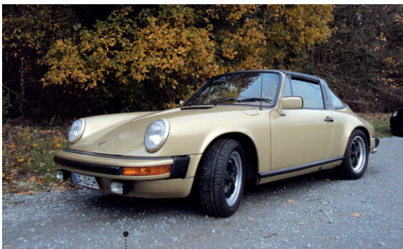
45 o Rolf Thelen und Isolde Böhlinger-Thelen Porsche 911 SC 3.0 Targa 2994 ccm | 180 PS | 1978