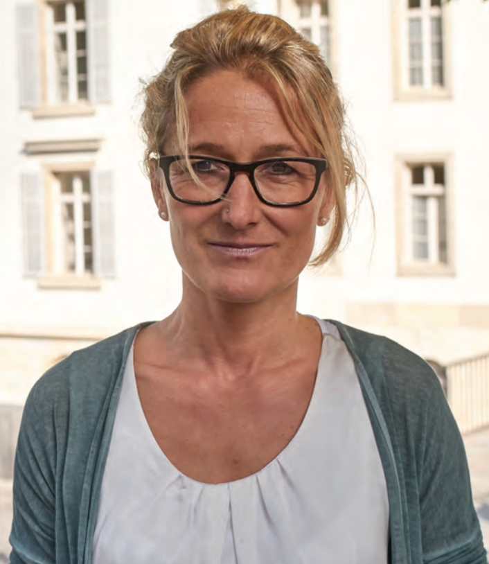
Susanne Hochuli, consigliera di Stato del Cantone di Argovia, capo del dicastero della sanità

« I Cantoni sostengono attivamente l'attuazione della strategia. Solo se utilizziamo gli antibiotici con cautela e in modo più mirato saremo in grado di preservarne l'effetto per il bene di tutti. »