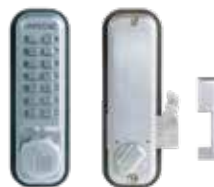
Verrou mécanique 2500 pêne en applique à crochet.