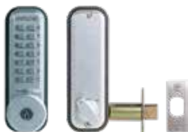
Verrou mécanique 2210CS pêne dormant à larder avec clé de secours.