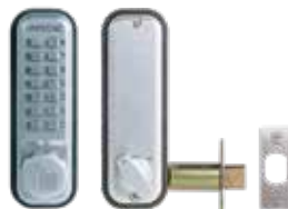
Verrou mécanique 2210 pêne dormant à larder.