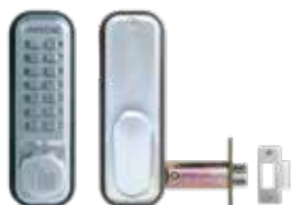
Verrou mécanique 2435 pêne demi-tour à larder, libre passage.