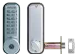
Verrou mécanique 2230CS pêne demi-tour à larder avec clé de secours.