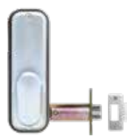
Avec pêne demi-tour à larder