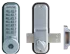
Verrou mécanique 2200CS pêne dormant en applique avec clé de secours.