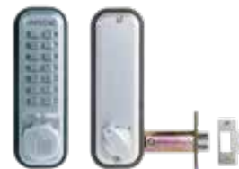
Verrou mécanique 2230 pêne demi-tour à larder.