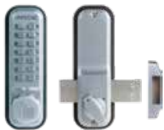
Verrou mécanique 2200 pêne dormant en applique, gris.