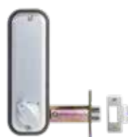
Avec pêne demi-tour à larder