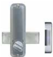
Avec pêne dormant en applique