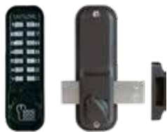
Verrou mécanique 2200 pêne dormant en applique, noir.