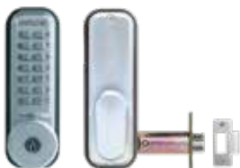
Verrou mécanique 2435CS pêne demi-tour à larder libre passage, avec clé de secours.