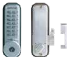
Verrou mécanique 2500CS pêne en applique à crochet avec clé de secours.