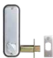
Avec pêne dormant à larder