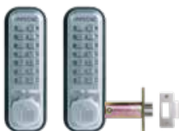
Verrou mécanique 2230DS pêne demi-tour à larder (double serrure).