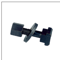
Réf. 9336 Jeu de coulisseaux T14