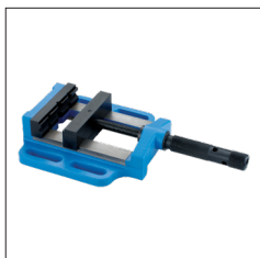
Réf. 9098 Etou manuel 130 mm