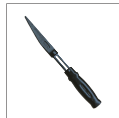
Réf. 2086 Chasse cône