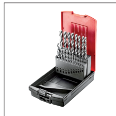
Réf. D-19GS Coffret 19 forêts HSS Co de 1 à 10 mm par 0.5