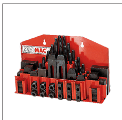
Réf. 9728 Assortiment cales de serrage T14