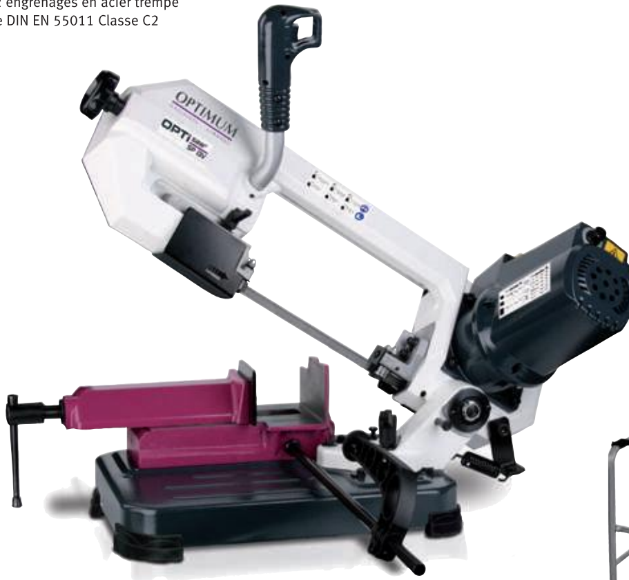
Fig.: SP 13 V