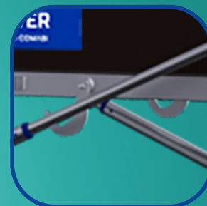
Crochets de transport du plancher

RÉGLABLE TOUS LES 25 CM DE 0,30 M À 1,80 M PLANCHER