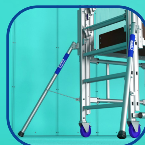
Stabilisateurs rétractables et orientables