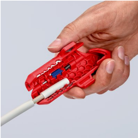
Dégainage d'un câble NYM