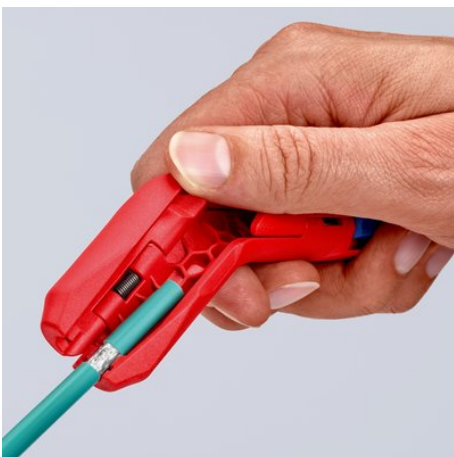
Dégainage d'un câble de données