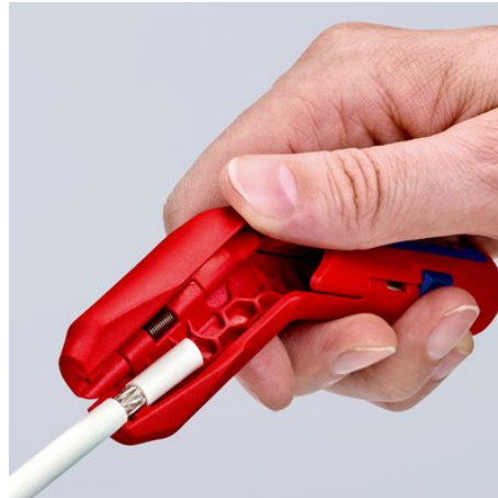
Dégainage d'un câble coaxial