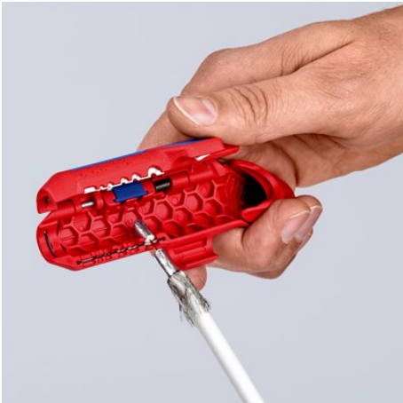
Dénudage d'un câble coaxial