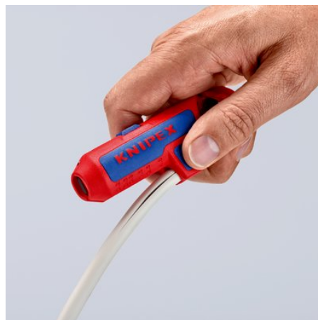
Avec une lame couverte dans une poignée en porte-à-faux latéral pour des coupes longitudinales faciles