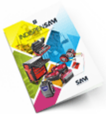
Les outils Indispensables SAM 2021