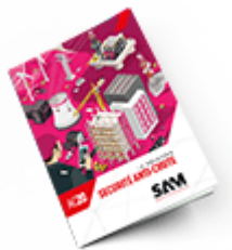
Sécurité anti-chute 2020