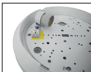
Connecteur rapide double entrée