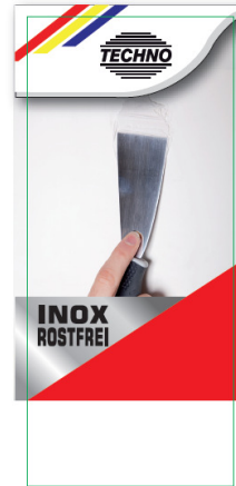
35 x 80