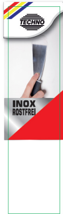
20 x 80