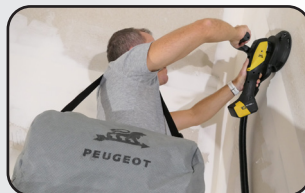
Aspiration autonome Autonomous collection dust