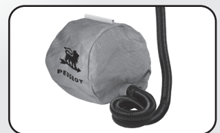
Livrée avec buse, flexible et sac à poussières Delivered with collector, flexible and dustbag