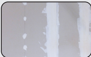
Spéciale plâtre Special for Plaster

* Livrée avec chargeur * Charger included