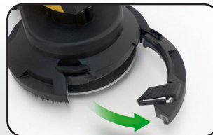
Carter escamotable, pour le ponçage en bordure Retractable tray cover for sanding angles