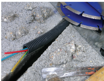
Disque de haute qualité High quality disc

Livré avec 2 disques ø 150 mm Delivered with 2 discs ø 150 mm