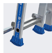
Les 2 crochets du plan sup. se placent sur les échelons du plan inf. lorsque l'échelle est à la bonne hauteur