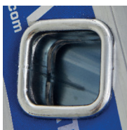
Ultra-résistance de l'échelon grâce au triple sertissage dans le montant