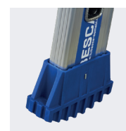
Sabots enveloppants haute sécurité