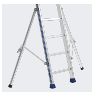
Stabilisateurs déployés : encombrement réduit de 40 à 50%