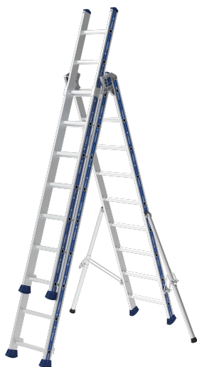
Modèle 3x9 échelons

L'échelle Platinum transformable 3 plans plus en aluminium dispose de stabilisateurs rabattables pour plus de compacité, de sabots enveloppants haute sécurité et d'une articulation brevetée Quick Safe qui en font la référence sur le marché. Elle garantit résistance, polyvalence et sécurité à tous ses utilisateurs. Avec des modèles de 3x7 à 3x12 échelons elle permet d'accéder jusqu'à 8m59 et offre 5 positions d'utilisation. Elle est normée EN 131, conforme au décret 96333 et au label NF.