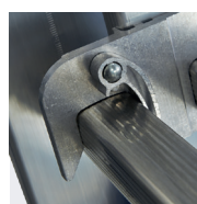
Crochets de verrouillage du plan coulissant