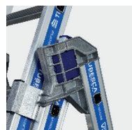
Ouverture intuitive et automatique de l'échelle grâce au système Quicksafe®