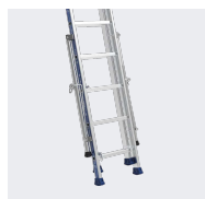
Stabilisateurs rabattables sur le plan arrière