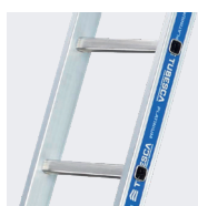
Espacement entre échelons 280 mm. Échelons 30 x 30 mm.