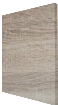
Cambrian Oak mélaminé structuré