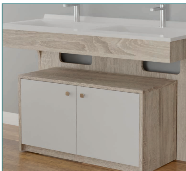
Mobiroul 90 sous meuble Altea 120.

Ci-dessus : caisson roulant Mobiroul 80 cm coloris Cambrian Oak.