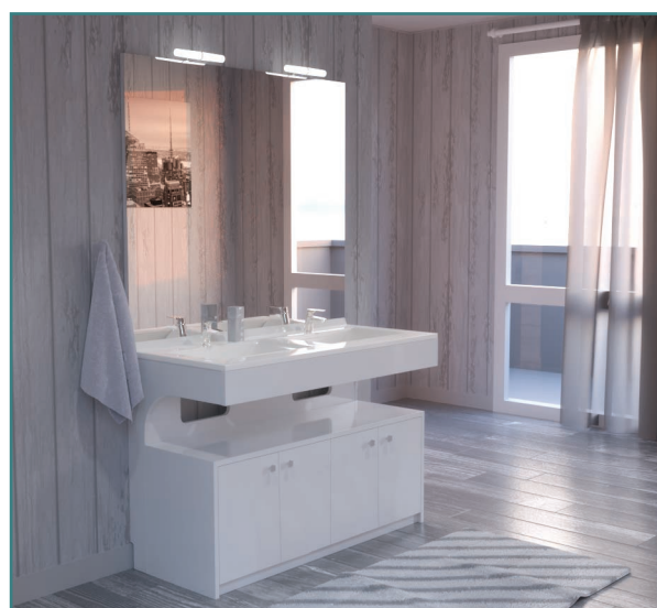
Mobiroul 120, accompagnant un meuble Epure et son miroir Mircoline