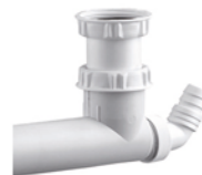
Spécial cuves décalées