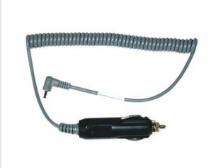
Eurocode 900507 Adaptateur voiture de chargeur