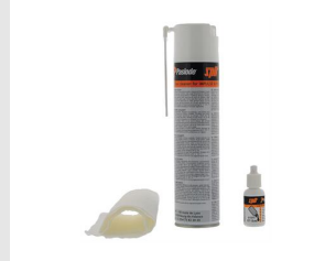
Eurocode 013690 Kit de nettoyage IMPULSE / PULSA