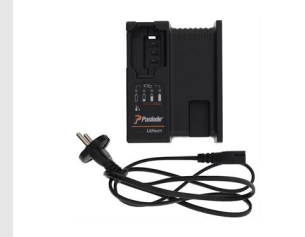
Eurocode 018881 Chargeur Paslode Lithium EU