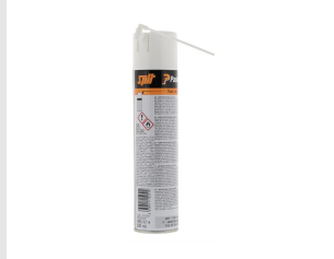
Eurocode 115251 Nettoyant IMPULSE & PULSA 300 ml