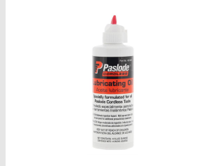
Eurocode 401482 Huile IMPULSE