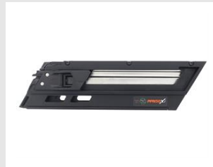
Eurocode 019768 Magasin PPN50Xi pour clous 60mm