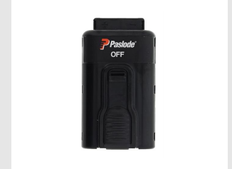
Eurocode 018880 Batterie Paslode Lithium