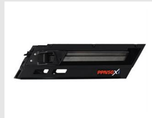
Eurocode 019767 Magasin PPN50Xi