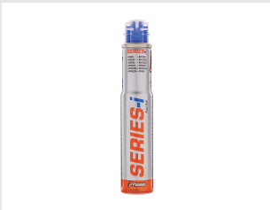
Eurocode 300348 Blister 1 cartouche IM90i / Ci