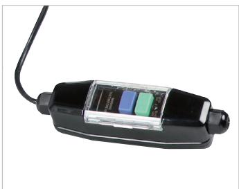
Prise de protection contre les surtensions PRCD socket