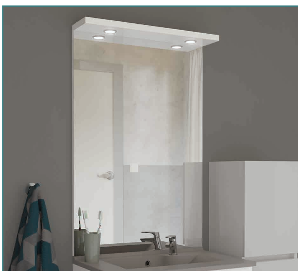
Mircoline (ht 105 cm) avec : bandeau LED deux spots

Mircoline : Le miroir dans sa plus simple expression collé sur PP de 16 mm. Existent en 105 x 60 / 70 / 80 / 90 / 120 / 140 cm .