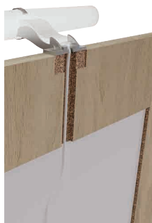
Découpe arrière facilitant l'installation des appliques