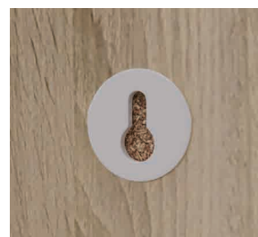
Système de fixation classique