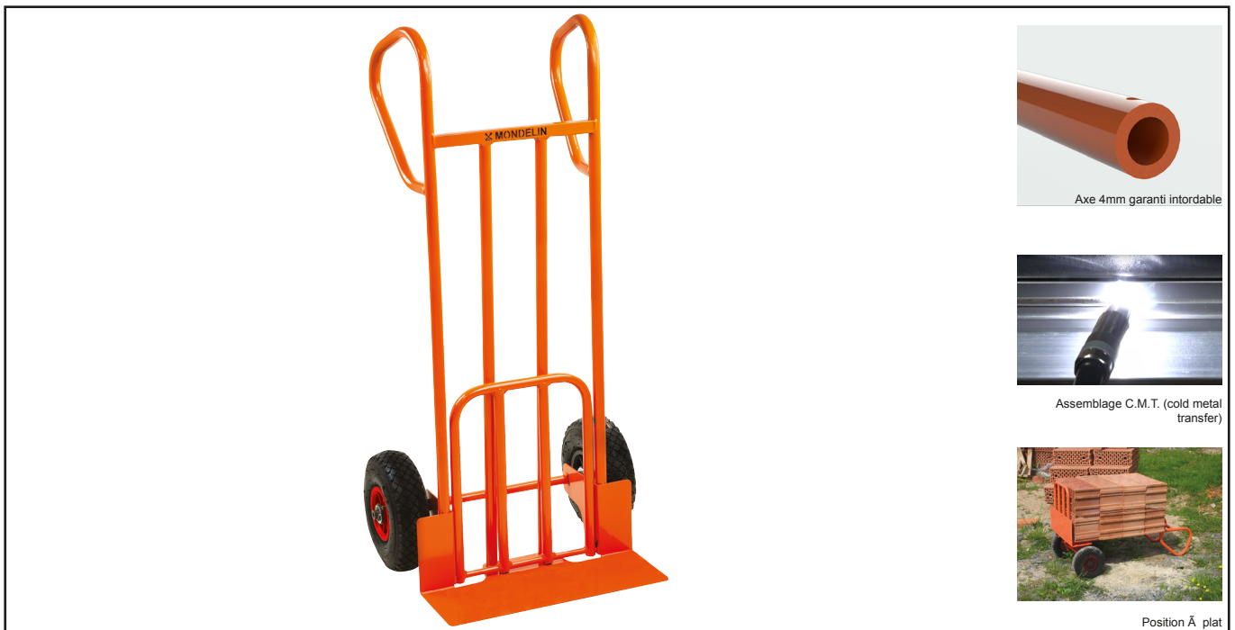
Axe 4mm garanti intordable

Diabie multi-usage, avec pelle fixe et rabattable. Charge utile : 250 kg. Roues increvables. Axe ultra-épais 4mm garanti intordable. Assemblage par soudure robotisée procédé C.M.T. (cold metal transfer) assurant une grande longévité du diabie. Structure résistante, tubes Ø 25 mm, épaisseur 1,5 mm. Pelle fixe épaisseur 3 mm. Pelle rabattable en tube Ø 22 mm, épaisseur 1,5 mm. Tube central carré de 25mm. Système de verrouillage de la pelle rabattable par goupille. Poignée fermée pour une grande maniabilité toutes positions et une protection des mains. Position à plat : les poignées servent de pieds pour mise à l'horizontale. Poignée cintrée fermée pour une prise en main facile dans toutes les positions et pour une pose à plat. Chargement possible en position horizontale. Roues increvables Ø 250 mm . Protections de roues : la charge n'entre pas en contact avec le pneu. Roues livrées montées, disponibles en pièce de rechange. Charge utile : 250 kg. Poids : 14 kg. Dimensions (L x l x h) : 590 mm x 470 mm x 1150 mm. Pelle fixe : largeur 485 x profondeur 160 mm Pelle repliable : largeur 320 mm x profondeur 350 mm. Conforme CE, Directive 2006/42/CE. Fabriqué en France dans nos usines. Existe en roues gonflables.