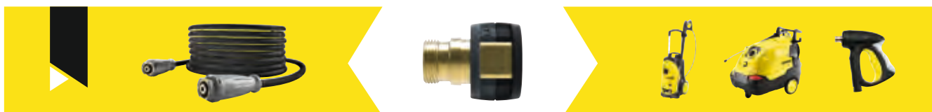
EASY!Lock - M 22 x 1,5

Réf. 4.111-030.0 Adaptateur pour raccordement de nettoyeurs haute pression / pistolets haute pression à raccord M 22 x 1,5 et flexibles haute pression équipés EASY!Lock.