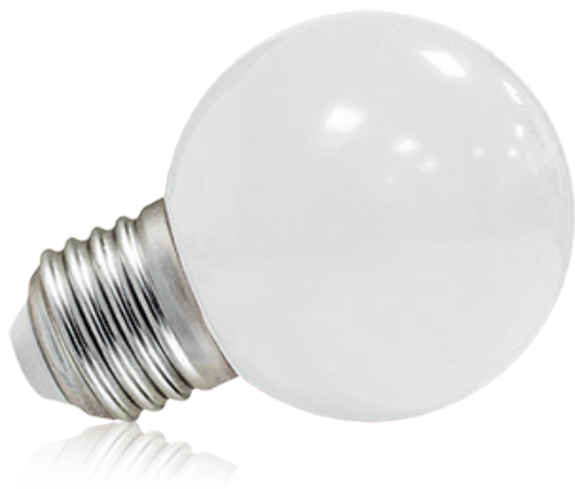
Ampoules incassables (globe en polycarbonate)