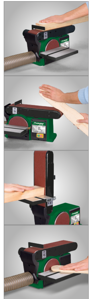
BTS 151 / BTS 150