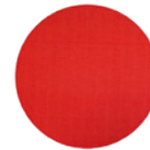
Fig. : Support Velcro · En option