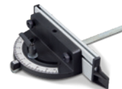
Fig. : Butée angulaire pour BTS 250 · En option