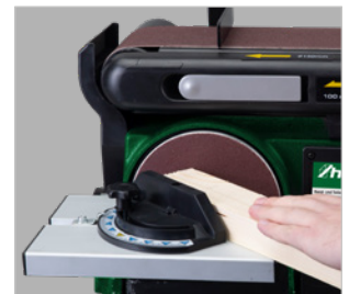
BTS 151 / BTS 150