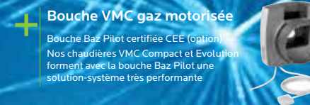
Bouche VMC gaz motorisée

Bouche Baz Pilot certifiée CEE (option) Nos chaudières VMC Compact et Evolution forment avec la bouche Baz Pilot une solution-système très performante