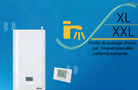
Hydromotrix Compact 25 kW

*Avec tubes semi-rigides pour remplacement chaudière autre marque, sans nécessiter de kit d'adaptation Chaudières en Gaz Naturel exclusivement - Pas de raccords pour circuit chauffage supplémentaire