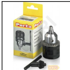
Dimension des taraudages des mandrins