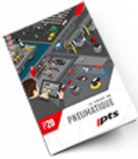
Pneumatique SAM 2020