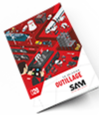
Outillage SAM 2020