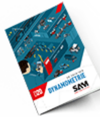
Dynamométrie SAM 2020