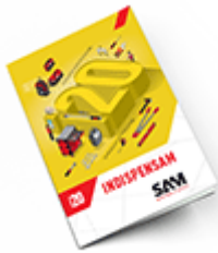
Les outils Indispensables SAM 2020