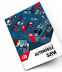
Automobile SAM 2020