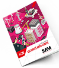
Sécurité anti-chute SAM 2020