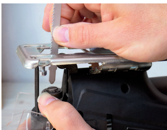
Éjection rapide de la lame Rapid ejection of the blade

Livrée avec 3 lames, guide parallèle et connecteur pour aspiration Delivered with 3 blades, parallel guide and dust connector