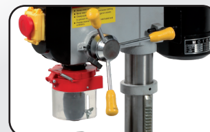
Cabestan droitier ou gaucher Right or left hand system