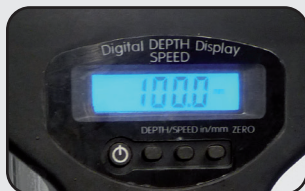
Affichage numérique vitesse / profondeur Speed / depth digital screen