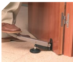
Pour le levage et la mise en place de portes lourdes.

Pédale articulée pour un levage horizontal de la porte jusqu'à 75 mm. Bec orientable, droite/gauche pour le déplacement latéral de la porte. Equipé d'un patin rotatif antidérapant en caoutchouc et d'une longue pédale d'appui avec butée évitant le contact du pied avec la porte. Le dessous arrière de la pédale est également muni d'un coussinet caoutchouc destiné à la protection du sol.