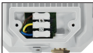
Connecteur interne + presse-étoupe + valve anti-condensation